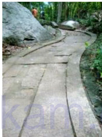
කළුගල් පෙත් මග

ශිලාමය පෙත් මං ඔස්සේ කන්ද මුදුනට ගමන් කරන විට කළුගල් ලෑල්ලක් යොදා සකස් කල ගල් පාලමක් මතින් පුස්තකාලය නොහොත් පොත්ගලට පිවිසිය හැක. මෙම ස්ථානය සාමාන්‍ය ගමන් මගෙන් මදක් බැහැරව තිබෙන නිසා බොහෝ දෙනෙකුට මග හැරී යා හැක. මෙම ස්ථානයෙන් දිය පහරක් ගලා බසින නිසා එහි නාදයත් සමග ඉතා නිස්කලංක බවක් පවතින අතර පොත් කියවීම සඳහා ගල් කොට්ටයක් සහිත ආසන සකස් කර ඇත.