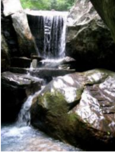
රිටිගල දිය ඇල්ල *