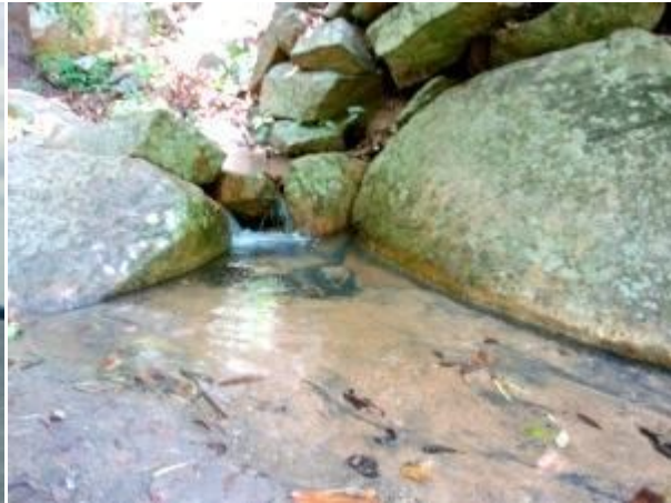
රිටිගල දිය පාරක්

පෙ.ව. 10.42 ට රිටිගලට හැරෙන මාර්ගය අසලට පැමිණි අප නාමපුවරු අනුව වමට හැරී පටු පාළු මාර්ගයක් ඔස්සේ 6 km ගමන් කළෙමු. විනාඩි 10කින් අප රිටිගල තොරතුරු හා පර්යේෂණ මධ්‍යස්ථානයට පැමිණියෙමු. එහි කුඩා නිවාස කිහිපයක් ඇති අතර අපගේ මග පෙන්වන්නා දයාරත්නඅප සමග එකතු විය. ඔහු සමග වමට හැරී පටු පාරක් දිගේ තවත් කිලෝමීටර් 2ක් පමණ වනාන්තරය ඇතුළට ගිය විට පුරාවිද්‍යා දෙපාර්තමේන්තුවේ කලාප කාර්යාලය අසලට පැමිණිය හැක. එහි වාහනය නතරකර ඉතිරි කොටස පයින් ගමන් කල යුතුය. ඇතුළු වීමට ප්‍රථම ඔබගේ නම ලිපිනය ඇතුළුවන වෙලාව ආදී තොරතුරු සටහන් කර අත්සන් ලබා ගනු ලබයි. එතැන් සිට ක්‍රමයෙන් පුරා විද්‍යා භූමියේ ඇති දෑ නැරඹිය හැකි අතර අතීතයේදී කළුගල් කඩා වෙන් කිරීම පිණිස තැනැත්තා සිදුරුවීද ඇති අයුරු නිරීක්ෂණය කල හැක. හෙක්ටෙයාර් 8ක ශිලාමය යෝධ පොකුණක නටබුන් ඔබට දක්නට ලැබෙනු ඇත. එය "බන්දා පොකුණ" නම් වේ. එය දකුණු ආසියාවේ ඇති විශාලම ශිලාමය පොකුණ වන අතර ජල ගැළුම් මිලියන දෙකකට අධික ජල ප්‍රමාණයක් පිරවිය හැක. එහි ගල් පඩි ආකාරයන් සියුම්ව කපා එකිනෙකට සම්බන්ධ කර බැමි හා පඩි සකස් කර ඇති අකාරය පුදුම උපදවයි. එහි සම්පූර්ණ බැමිමම අද දක්නට අපහසු අතර ඉතුරු කොටස වනාන්තරයෙන් වැසී ඇත. මෙම පොකුණ රිටිගල වැඩ සිටි සංඝයා වහන්සේගේ පැන් අවශ්‍යතා සඳහා භාවිතා කරන්නට ඇත.