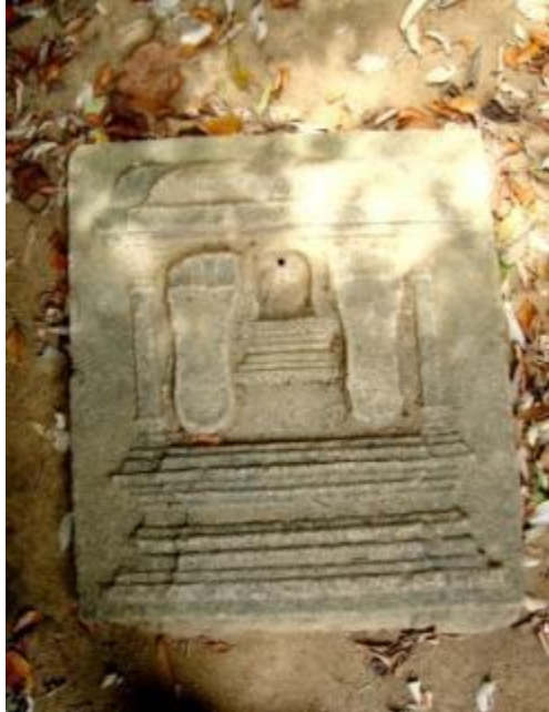
මුත්‍රා කිරීමට සැකසූ ගල