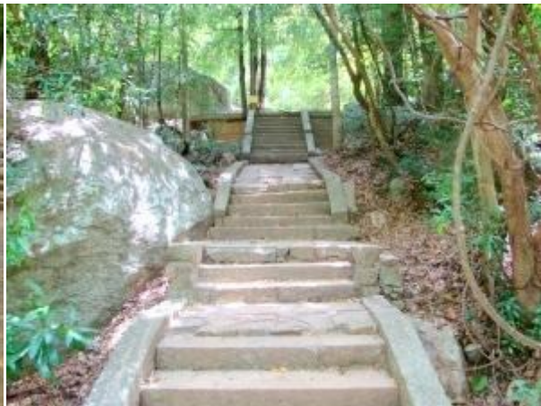
කළුගලින් නිම කල පඩි සහිත මාර්ගය