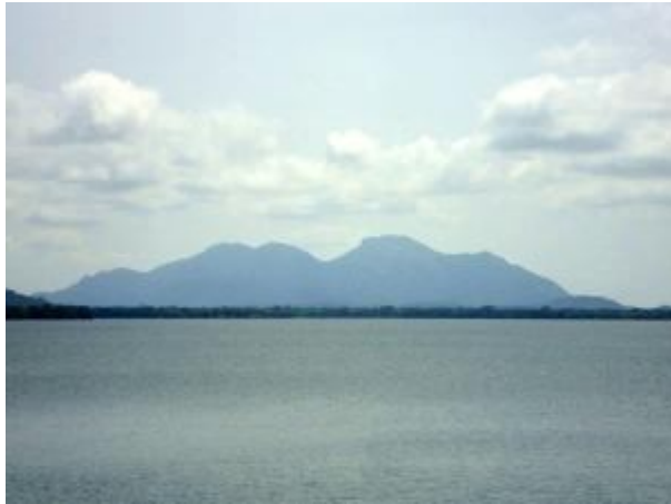
කලාවැවට ඔබ්බෙන් දර්ශණය වන රිටිගල කඳු

එහි ළඟා වීමු. පැය භාගයක් පමණ විහාරස්ථානය වන්දනා කර එය නරඹා නැවත ගමන් ආරම්භ කළෙමු. පෙ.ව. 10.05 පමණ වනවිට කලා වැව අසලට ලඟා වූ අප වාහනයෙන් බැස අවට සුන්දරත්වය වින්දෙමු. වැවට එපිට ඇතින් රිටිගල කඳු පන්තිය ඇතුළු අනෙකුත් කඳුද ඉතා අලංකාර ලෙස දර්ශනය විය.