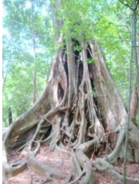
පැරණි නුග ගහ

වනජීවී සංරක්ෂණ දෙපාර්තමේන්තුව විසින් ඇතුළුවීම තහනම් බව දැක්වෙන දැන්වීම් පුවරු වනාන්තරය කෙලවරට වන්නට සවි කර ඇත. උණ කන්ද ආදී අනෙකුත් කඳු වලට පිවිසෙන ස්ථාන අවහිර කර අලි වැටකට සමාන වැටක් ඉදි කර තිබෙනු දක්නට ඇත. කන්දෙන් පහල පිහිටි පුරාවිද්‍යා කාර්යාල භූමියට ජලය ගෙන සපයන ටැංකිය නිල්පැහැ ජලයෙන් පිරී ඇති අයුරු දක්නට හැක. නටඹුන් අතර ඇති මුත්‍රා පහ කිරීමට සකස් කර ඇති අඩි දෙක හමාරක් පමණ පළලින් යුතු අලංකාර කළුගල් ලැල්ලක්ද වේ. ඉතාමත් පැරණි යෝධ නුගගසක් මෙම වනාන්තරයේ දක්නට ඇත. ඊට නුදුරින්විශාල කළුගල් මත සිටිනා යෝධ පිඹුරෙකු මෙන් දිස් වෙන "වෙම්බන්ගා" වැල්දැකිය හැක.