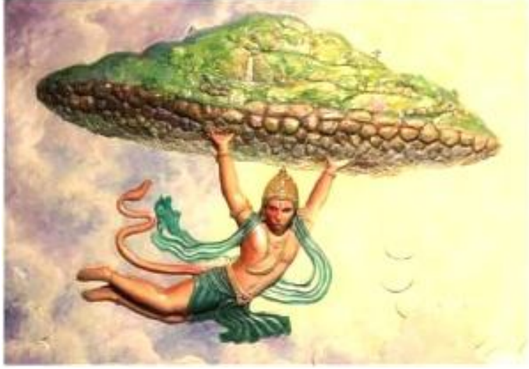
හනුමා විසින් බෙහෙත් කඳු කොටසක් ඉන්ද්‍රියාවෙන් රැගෙන ඒම *

1887 දී ඉංග්‍රීසි ජාතික හෙන්රි රිච්මන් මහතා කඳු වැටියේ උද්භිද විද්‍යාත්මකව ඇති වැදගත්කම පිළිබඳව අධ්‍යයනයක් කර ඇත. ශාඛ වර්ග 337කින් 57ක්ම ලංකාවට ආවේනික ශාඛ වේ. එකිනෙකට වෙනස් වූ පරිසර පද්ධති 3ක් රිටිගල ආශ්‍රිතව දක්නට ලැබේ. කන්දේ පහලම කොටස වියලි හා මිශ්‍ර සදා හරිත වනාන්තරයක ලක්ෂණ පෙන්වයි. පලු, හල්මිල්ල, කලුවර, මොර, නා, සහ වීර වැනි ශාඛවල කොටසේ දක්නට ලැබේ. කන්දේ මැද කොටස තෙත්කලාපීය වනාන්තරයක ලක්ෂණ උසුලයි. එහි නා, කැන්ද, ඇටඹ, කුඩුදවුල, ඔමාර වැනි ශාඛ දක්නට ඇත. කන්දේ මුදුන් කොටස කඳුකර වනාන්තර ලක්ෂණ පෙන්වන අතර එහි බිනර, නෙළු, කැකුණ, දුම් ශාඛ දක්නට ඇත. සමහර කාලවල කන්ද මිදුම්න් වැසී පවතී. රිටිගල ගල් කප්පරවල්ලිය, රිටිගල තම්බර්ජියා, රිටිගල නෙළු, රිටිගල වන මී, රිටිගල උණ, යනාදී ලෙස නම් කර ඇති, රිටිගල වනාන්තරයට ආවේනික ශාඛ වර්ග 5 ක්ද හඳුනාගෙන ඇත. දුර්ලභ ඖෂධ ශාඛ වන අරළු, බුළු, නෙල්ලි, බිංකොහොඹ, වල්නවහන්දි, මහහැඩයා, රණවරා, පට්ටතු, කොතලහිඹුටු, ගම්මාලු, සැවැන්දරා, ඉර රාජ, සඳ රාජ, වන රාජ, බිම් කොහොඹ, ජටා මකුල, නගා මැරු ඇල, වෙල්ලන්ගිරිය, රුදන්ති, සන්සෙවි, ඇතුළු ඉතා වටිනා බෙහෙත් පැළෑටි රැසක් රිටිගල දක්නට ඇත. පක්ෂි විශේෂ 97ක් පමණ මෙහි ජීවත්වන අතර ඉන් 8ක් ශ්‍රී ලංකාවට ආවේනික වේ. දිවියා, අඳුන් දිවියා, තිත් මුවා, ගෝනා, වලසා, වල් ඌරා, පිඹුරා වැනි සතුන් වනාන්තර කොටසේ ජීවත් වේ. රිටිගල කඳු පන්තියේ අක්කර 690ක ප්‍රදේශයක් පුරාවිද්‍යා දෙපාර්තමේන්තුව යටතේ පවතී. සමස්ත කඳු පන්තිය හා වනාන්තරය, දැඩි රක්ෂිතයක් ලෙස වන ජීවි සංරක්ෂණ දෙපාර්තමේන්තුව මගින් පාලනය වේ. එයට ඇතුළු වීම සපුරා තහනම්ය.