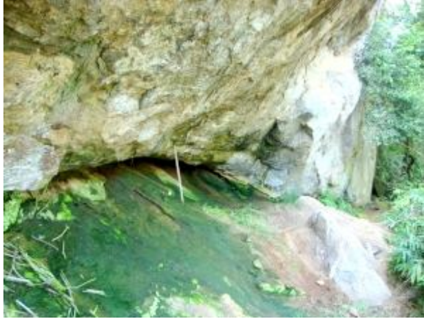
සියුම් දිය සිරාවක් සහිත තෙත් ස්ථානයක්