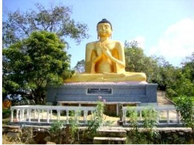
පර්වත මුදුනේ ඇති නව බුදුපිළිම වහන්සේ

මෙම විහාරස්ථානයේ ලෙන් අතර යම් අද්භූත බවකින් යුතු ගල්ගුහා 4ක් ඇත. ඉන් එක් ගුහාවක් තුළ අප්‍රකටව ඇති දිගින් අඩි දහනවය හමාරක් (19.5) වන සෙල් ලිපියක් ඇති බව කිය වේ. එයට පිවිසීමට ඇති ගුහා කට සම්පූර්ණයෙන් වසා දමා ඇත. තවද ගිරි ශිඛරයේ සිට කැළණි ගඟ දක්වා දිවෙන භූගත උමගක් මෙහි ඇතත් මෙම උමගේ කටද අද වන විට වැසී පවතී. ක්‍රි.ව. 1415-1467 කාලයේදී 6 වන ශ්‍රී පරාක්‍රමබාහු රජු සේනා රැස් කරන සමයේ මෙම උමග කර වූ බවට පැවසේ. එකල ජල හිඟයක් පැවති නිසා ආරක්ෂිතව කැළණි ගඟට ගොස් ජලය ගෙන ඒමට මෙම උමග යොදාගත් බවට කිය වේ. ගිරි ශිඛරයේ සිට කැළණි ගඟේ ගල් කුලක් දක්වා දිවෙන උමගේ උමංකටේ ගල්පඩි, ගඟේ ජලය අඩු කාලයට දිස්වෙන බවට ප්‍රදේශවාසීන් පවසති. මීට අමතරව කොරතොට විහාරය දක්වා දිවෙන උමගක්ද ඇති බවටද ජනප්‍රවාදයක් ඇත. සීතාවක පළමුවන රාජසිංහ රජුද කැළණි ගඟ ආශ්‍රිතව උමං මාර්ග ඉදි කර පෘතුගීසීන්ට පහර දුන් බවට කියවේ.