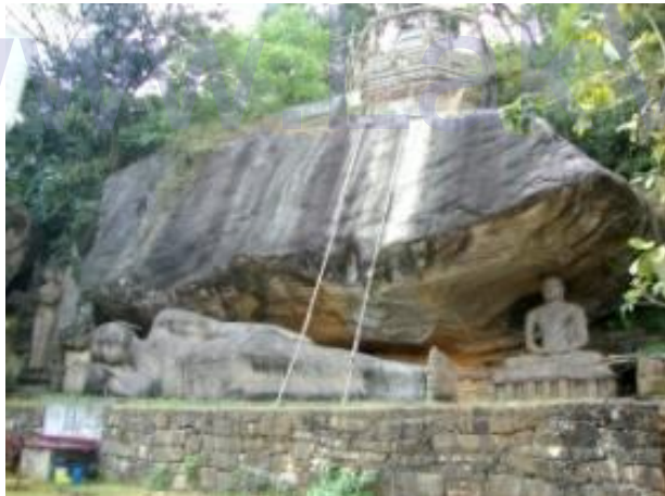
පොළොන්නරුව ගල් විහාරයේ අනුරුව

මහාවංශය හා ධර්ම ප්‍රදීපිකාව නම් ග්‍රන්ථ වල දැක්වෙන පරිදි චූල්ලනාග නම් මහ රහතන් වහන්සේ රත්ගල් වෙහෙරට වැඩමකර ජප්තක සූත්‍රය දේශනා කල බවත් එය ශ්‍රවණය කිරීමට හික්ෂුන් වහන්සේ 12000 ඇතුළුව යොදුනක් දුරට දෙවියන්ද, ගව්වක් දුරට මනුෂ්‍යයන්ද පැමිණි බවට සඳහන් වේ. සාඤ්ච සුදනිය 1025 පිටුවෙහි දැක්වෙන්නේ ක්‍රි.පූ. 500 දී මෙම ස්ථානයේ වැඩ විසූ මහා මලියදේව රහතන් වහන්සේද ජප්තක සූත්‍රය දේශනා කර ඇති බවයි. මෙම අවස්ථාවේදීද යොදුනක් දුරට දෙවියන්ද, ගව්වක් දුරට මනුෂ්‍යයන්ද එය ශ්‍රවණය කල බවත් සෑට නමක් රහත් වූ බවත් සඳහන්ය.