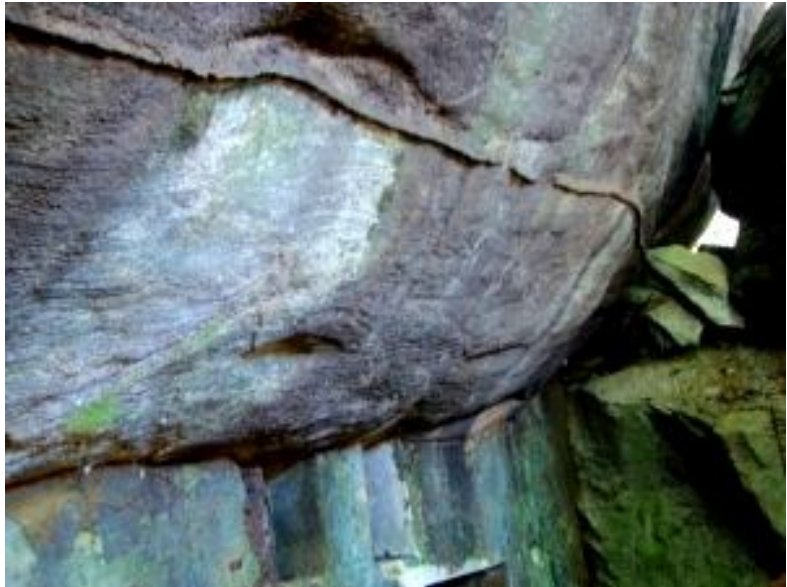
කටාරන් සහිත ලෙන්