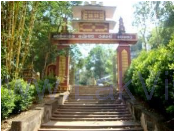
ඉහල විහාරයේ පිවිසුම් තොරණ

ඔබ එහි යන්නේ නම් සංවර ඇදුමකින් සැරසී අනවශ්‍ය ලෙස ශබ්ද නොනගා ගමන් කිරීමට මතක තබා ගන්න. අනවශ්‍ය ශබ්ද වලින් එහි සිටිනා බඹරුන් කලබල වී ඔබට පහර දීමට බොහෝ ඉඩ ඇත. එසේම සංවර ලෙස හැසිරීමටත්, පූජා භූමියේ ගෞරවය රැකෙන ලෙස කටයුතු කිරීමටත්, එය අපිරිසිදු නොකිරීමටත් වග බලා ගන්න. ඉහල පන්සල වැද පුදා මහා මාර්ගයෙන් අනෙක් පස පිහිටි පහල පන්සලද වැද පුදා ගැනීමටද අමතක නොකරන්න.