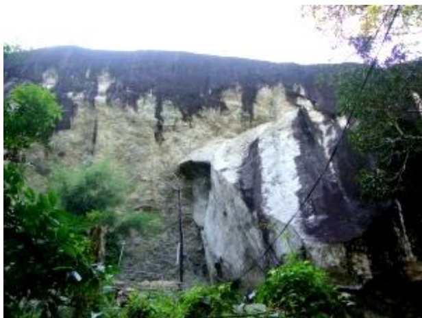
ප්‍රධාන කළු ගල් පර්වතය

ඉතාමත් දීර්ඝ ඉතිහාසයකට උරුමකම් කියන මෙම විහාරස්ථානය හැදින්වීමට අතීතයේ සිට විවිධ නම් භාවිතා කර ඇති බවට පෙනී යයි. කෙලාසකුට පබ්බතය, අම්බිලි ග්‍රාම වෙහෙර, ඇඹුල්පස වෙහෙර, ඇඹිල්ල වෙහෙර, ඇඹුල්හෙලු වෙහෙර, රත්ගල් වෙහෙර, ඇඹුල්ගම රජමහා විහාරය යන නම් ඉන් ප්‍රධාන වේ. ඇඹුල්ගම යන ග්‍රාම නාමය නිර්මාණය වී ඇත්තේ එකල සියම් මහා නිකායේ මහා නා හිමියන් ඇතුළු රජදරුවන්ට ඇඹුල සැපයූ නිසා බවට අදහසක් ජනප්‍රවාදයේ එයි. දුර්ලභ පිහිටීමක් සහිත මෙම විහාරස්ථානය කැළණි ගඟට ඉතාමත්ම ආසන්නයෙන් සුවිසල් කළුගල් පර්වතයක් ආශ්‍රිතව පිහිටා ඇත. මෙම කළුගල් පර්වතය බැලූ බැල්මට යම් අද්භූත බවකින් පිරි ගිය එකකි. එය මිහින්තලා සෙල් ලිපියෙහි “ලිහිණි පව්ව” නමින් හඳුන්වා දී ඇත. එහි විශාල ලෙන් හා පරිවාර ලෙන් 32ක් පමණ පිහිටා ඇත. මෙම ස්ථානය කැළණි ගඟට ආසන්නයෙන් පිහිටා තිබීම නිසා ප්‍රාග් ඓතිහාසික යුගයේ සිට ආදි වාසී, මානව ක්‍රියාකාරකම් ලෙන් ආශ්‍රිතව සිදුවන්නට ඇතැයි අනුමාන කල හැක. එහෙත් මෙම ස්ථානයේ පුරාවිද්‍යාත්මක කැනීම් ආදිය සිදු කර නොමැති නිසා මෙතෙක් එවැනි සාක්ෂි මතු කරගෙන නොමැත. අතීතයේ යක්ෂ ගෝත්‍රිකයින් මෙම ප්‍රදේශය අවට ජීවත් වූ බවට සාක්ෂි ඇති නිසා රාවණා රජුගේ කාලයේදීද මෙම ස්ථානය වැදගත් කාර්යභාරයක් ඉටු කරන්නට ඇතැයි විහාරාධිපති පුජ්‍ය පුජ්‍ය දං කන්දේ බෝධිවංශ හිමියන්ගේ අදහසයි.