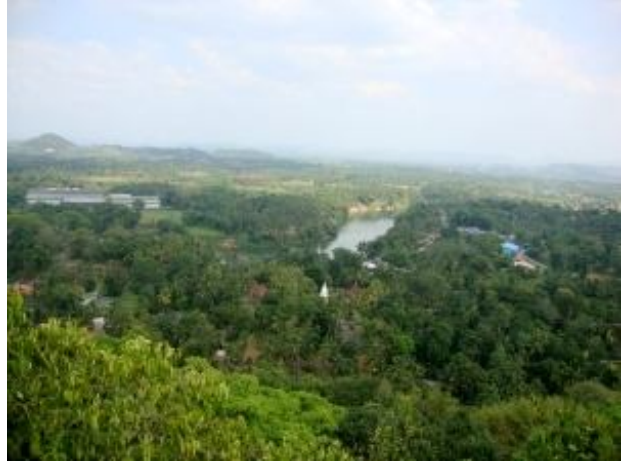
කැළණි ගඟ සහ අවට දසුන්