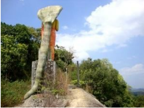
පර්වත මුදුනේ නාගයකු සහිත හිටි පිළිමය