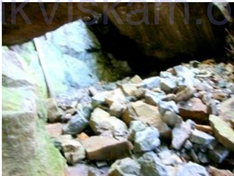
මහා ලෙන් වල අද තත්වය

ක්‍රි.ව. 568 දී 1 වන අශ්වමේ රජු මෙම විහාරය ඇඹිල්පස ගම් වෙහෙර ලෙස නම් කර විහාරයෙන් ලැබෙන සියළු අදායම් අනුරාධපුර මහා විහාරයට පූජා කල බවට මහාවංශයේ 41 පරිච්ඡේදයේ 18, 19, 20 යන ගාථා වල සඳහන් වේ. එමෙන්ම ක්‍රි.ව. 955-972 කාලයේ 5 වන මිහිඳු රජු (සිරි සංඝබෝධි අභය) විසින් මෙම වෙහෙරේ අදායම මිහින්තලයට පූජා කල බව මිහින්තලා සෙල් ලිපියේ දැක් වේ. ක්‍රි.ව. 1220-1246 කාලයේදී ලංකාවට එල්ල වූ කාලිංග මාස ආක්‍රමණ කාලයේ 3 වන විජයබාහු රජතුමා මෙම ප්‍රදේශයට පැමිණ ලෙන් ආදියෙහි විහාරාරාම කරවා