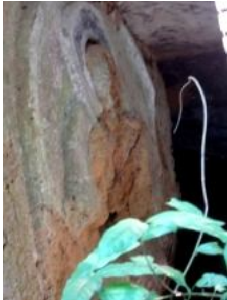
පුරාණ සත් සති විහාර නටබුන්

භාවනායෝගී භික්ෂුන් වහන්සේට පූජා කළේය. රජු ඇඹුල්ගම වෙහෙරේද ප්‍රධාන ලෙන් 3ක කටාරන් කොටා සකස් කර විහාර කරවා සංඝයා වහන්සේට පූජා කර ඇත. ඉන් එක් ලෙනක සත් සතිය නිරූපණය කර කුසලානගම යන නමින් පූජා කර ඇත.