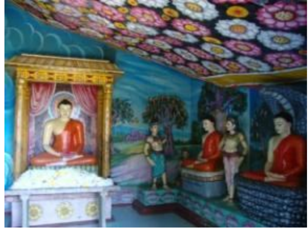
සත් සති විහාරය

ජයශ්‍රී මහා බෝධියේ දෙතිස්ඵල බෝධීන් වන්සේලාගෙන් එක් නමක්, එනම් 32 වන ශාඛාව ඇඹිල්ල වෙහෙරේ රෝපණය කල බවට බෝධිවංශයේ 383 ගාථාවේ සඳහන්ය. පසුකාලීනව කාලිංග, මහමදික, පෘතුගීසි, ලන්දේසි, සහ ඉංග්‍රීසීන් විසින් මෙහි වූ ලෙන් විහාර ආදිය කඩා විනාශ කරන්නට ඇති බවට විශ්වාස කරනු ලබයි (ක්‍රි.ව. 1576දී පමණ දියාගුද මැලෝ නැමැත්තාද පසුව ඉංග්‍රීසීන්ද මෙම විහාරය කොල්ලකා ඇත). දෙතිස්ඵල බෝධීන් වහන්සේද ඔවුන් විසින් විනාශ කරන්නට ඇතැයි සිතිය හැක. බෝධීන් වහන්සේ තිබුණේයැයි සැලකෙන ස්ථානය අවට ඇති ගල් වලවල් මෙම විනාශයට සාක්ෂි දරයි. ඉංග්‍රීසීන් විසින් විහාරය සතු ඉඩම් ඔප්පු මගින් වෙනත් අයට පවරා දීමක් කරනු ලැබ ඇතත් එම පැරණි ඉඩම් තෝම්බු වල පැරණි නාමය බෝධිවත්තලෙස දක්වා ඇති බවට දක්නට ලැබේ.