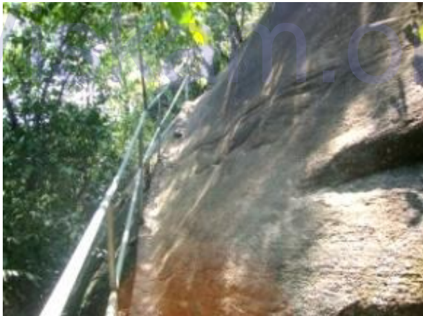
වැටවල් යොදා ඇති අනතුරුදායක මාර්ගය

චූලෝදර-මහෝදර ආරවුල සමථයකට පත් කිරීම පිණිස දෙවන වරටත් ලක්දිවට වැඩම කල බුදුරජාණන් වහන්සේ ඇතුළු තවත් හික්ෂුන් වහන්සේ 500නමක් කෙලාසකුට පබ්බත ලෙන් වල විශාලතම ලෙන වන රජතමය ලෙනෙහි වැඩ සිටි බවට කරුණු සඳහන් වේ. මෙම තොරතුරු දීපවංශ, මහාවංශ ආදී ආදී ග්‍රන්ථ වල දක්වා තිබී පසුව ඒවා ඉන් ඉවත් කරන්නට ඇතැයි අනුමාන කරනු ලබයි. මෙම ඉවත්කල තොරතුරු අලලා පසුව ලියන ලද මහාවංශ ටීකාව වන වංසන්ථප්පකාසීනියේ මේ කරුණු සඳහන් වේ. වංසන්ථප්පකාසීනියට අමතරව චේතියවංශ අට්ට කතාවේද, උත්තර විහාරට්ට කතාවේද මේ පිලිබඳව කරුණු සඳහන් වේ. මක්කම සිට වැඩම කල බුද්ධත්ස්ස හිමියන් කැළණි විහාරයේ වැඩහුන් හික්ෂුන් වහන්සේ 6000කටත්, සමන්ගිර විහාරයේ වැඩ සිටි හික්ෂුන් 900කටත්, කෙලාසකුට පබ්බතයේ වැඩහුන් හික්ෂුන් 6000කටත් තණ සහලින් සකසා ගත් දානය පිළිගැන්වීම හේතු කොටගෙන කෙලාසකුට පබ්බතය, අම්බිලි විහාරය යන නාමයද පටබැදී ඇත.