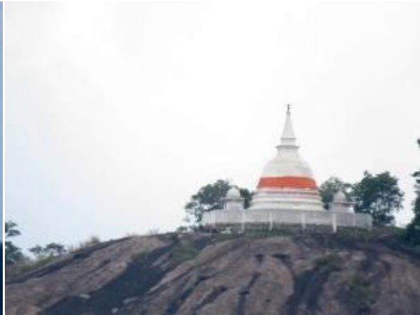
මාලිගාතැන්නරජ මහා විහාරය

බැලුම්ගල පිටුපසින් අන්තාසි වගා කරන ලද භූමියකුත් ඊසාන දෙසින් මාලිගාතැන්නරජමහා විහාර පර්වතය දක්නට ඇත. එසේම ඉහල සිට පහතට ඉරි මෙන් දාර සහිත විශාල ගල් පර්වත කිහිපයක්ද වනාන්තරයෙන් පැනනැගී තිබෙන ආකාරය ඉතාමත් අලංකාර දසුනකි. බොහෝ වෙලාවක් බැලුම්ගල මුදුනේ කාලය ගතකල අප සිවු දෙනා නැවත අඩිපාර දිගේ විහාරයේ පහලට පැමිණියෙමු. "දේවාල ලෙන" තුළ පිහිටි පන්නිනි දේවාලය වන්දනා කල අප පුරාවිද්‍යා කාර්යාලය අසලින් විහිදෙන මීළඟ පෙත් මග ඔස්සේ අනෙකුත් ලෙන් නැරඹීමට පිටත්වූයෙමු.