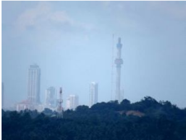
කොළඹ නගරයේ උස් ගොඩනැගිලි

විශාල මදුරු ගහනයක් සිටින නිසා මාගේ පුංචි පුතුට උන්ගෙන් දැඩි බාධා එල්ල විය. වනාන්තර තුළින් විහිදුණු අඩි පාර යකඩ වැටක් සහිත ගල් පඩිපෙළකට යොමු විය. ඒ ඔස්සේ ඉහලට නැග විශාල එළිමහන් ගල්තලාවකට පිවිසිය හැකි විය. එළිමහන් ගල් තලාව ඔස්සේ දකුණු දිගින් පර්වතයේ ඉහලටම ගමන් කල හැක. ගලේ මුදුන්ම ස්ථානයට සතර අත මැනවින් දිස් වේ. මේ නිසා එය "බැලුම්ගල" ලෙස හඳුන්වයි. මෙම ස්ථානයට ඉදිරිපස (වයඹ දිශාව) දෙස සැලකිල්ලෙන් බැලූ විට කටුනායක ගුවන්තොටුපොළට ගුවන්යානා පැමිණෙන ආකාරයත්, උඩරට දුම්රිය මාර්ගය ඔස්සේ දුම්රිය ධාවනය වන ආකාරයත්, වම්පසට (නිරිත දිශාව) වන්නට කොළඹ නගරයේ වරාය ඇතුළු උස් ගොඩනැගිලි සියල්ලත්, හොඳින් දර්ශණය වේ.