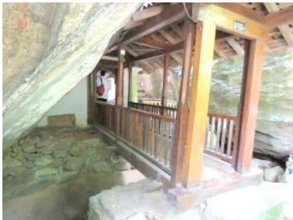
ඓතිහාසික දැවමුවා පාලම

විහාර භූමිය ඇතුලට ගමන් කිරීමෙන් පසු දකුණු අත දෙසින් කළුගලක් මත පිහිටුවා ඇති සන්ථාර කුළුනක් ඉංග්‍රීසි, ඕලන්ද, මහනුවර යුග වලට අයත් සංඝ ආවාස ගෙවල් දක්නට ඇත. ඒ දෙසට ගමන් කර මහනුවර යුගයේ ලෙන් ආවාස අතරින් ගියවිට ඉපැරණි දැවමය පාලම හමු වේ. ඊට ඔබ බෙත් පැරණි වැව දක්නට ලැබේ. ආපසු හැරී විහාරස්ථානයට ඇතුළු වූ ස්ථානයට ගමන් කිරීමේදී ධර්ම ශාලාව හා පැරණි පොකුණ දක්නට ලැබේ. භූගත ජල මාර්ගයක් ඔස්සේ මෙම පොකුණට ජලය ලැබෙන බවට කියවේ. ඉන්පසු හමුවන්නේ ඉපැරණි “කුමර, කුමරි” බෝධීන් වහන්සේ දෙනමයි. මින් විශාලව කෙලින් වැඩුණු බෝධිය “කුමර බෝධිය” ලෙසත් අනෙක “කුමරි බෝධිය” ලෙසත් හඳුන්වයි.