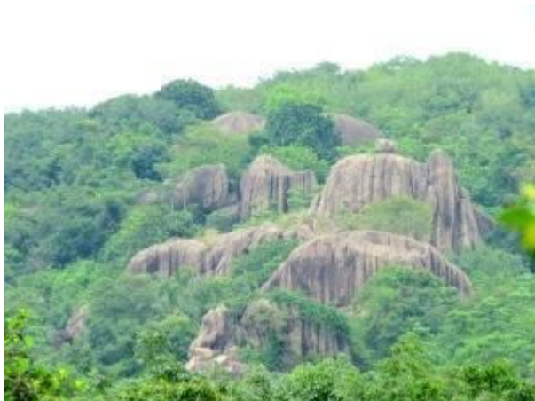
දාර සහිත විශාල ගල් පර්වත

බැලුම්ගල පිටුපසින් අන්තාසි වගා කරන ලද භූමියකුත් ඊසාන දෙසින් මාලිගාතැන්නරජමහා විහාර පර්වතය දක්නට ඇත. එසේම ඉහල සිට පහතට ඉරි මෙන් දාර සහිත විශාල ගල් පර්වත කිහිපයක්ද වනාන්තරයෙන් පැනනැගී තිබෙන ආකාරය ඉතාමත් අලංකාර දසුනකි. බොහෝ වෙලාවක් බැලුම්ගල මුදුනේ කාලය ගතකල අප සිවු දෙනා නැවත අඩිපාර දිගේ විහාරයේ පහලට පැමිණියෙමු. "දේවාල ලෙන" තුළ පිහිටි පන්නිනි දේවාලය වන්දනා කල අප පුරාවිද්‍යා කාර්යාලය අසලින් විහිදෙන මීළඟ පෙත් මග ඔස්සේ අනෙකුත් ලෙන් නැරඹීමට පිටත්වූයෙමු.