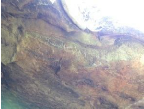
ප්‍රධාන සෙල් ලිපිය

රාවනා යුගයට පිළිකුත්තුව ඇතුළු ගම්පහ දිස්ත්‍රික්කයේ ඇති සම්බන්ධය