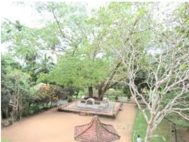
කුමර කුමරි බෝධිය