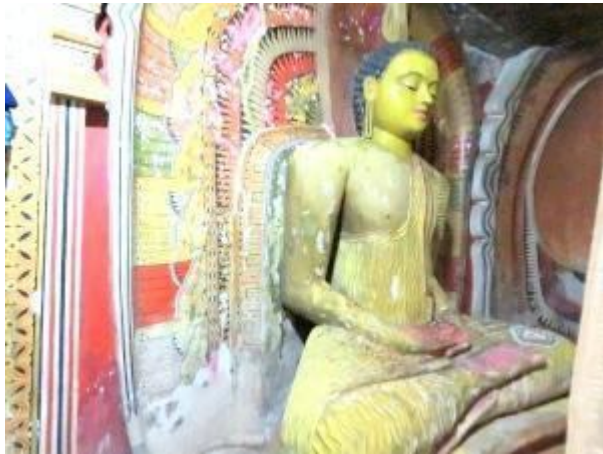
විහාර ගෙය ඇතුළත

ඉන්පසු ඔබට හමුවන්නේ ලෙන් විහාරයයි. ස්වභාවික වටදාගෙයකින් ආරක්ෂා වූ වෛත්‍යකින් යුතු මෙම විශාල ලෙනට ඉහලින් කටාරම් කොටා ඇති අතර පසුකාලීනව මෙම විහාරගෙය සාදන්නට ඇත. සමාධි පිළිමය, සැතපෙන පිළිමය, හිටි පිළිමය වශයෙන් බුදු පිළිම තුනක් විහාර ගෙය තුළ පිහිටුවා ඇත. මහනුවර යුගයට අයත් දර්ශණය බිතු සිතුවම් රැසක් දක්නට ඇත. මහා කප්ප, වෙස්සන්තර, ධර්මපාල ජාතකය ආදී ජාතක කතා මෙම සිතුවම් වලින් නිරූපණය කර ඇත. දොරටු පාල රූප සිතුවම් කර ඇත්තේ ලන්දේසි සොල්දාදුවකුගේ පරිද්දෙනි. සැතපෙන පිළිමය අසල මෙහෙණින් වහන්සේලාගේ සිතුවම් දක්නට ඇත. ලග්න පිළිබිඹු වන ආකාරයට ලෙනේ ඉහල කොටස සිතුවම් කර ඇත. සමහර බිතු සිතුවම් අපැහැදිලි වී විනාශ වී යන ස්වභාවයක්ද දක්නට ඇත. නිසි සංරක්ෂණයට වහා පියවර නොගතහොත් ඒවා අනාගත පරපුරට අහිමි වනු ඇත.