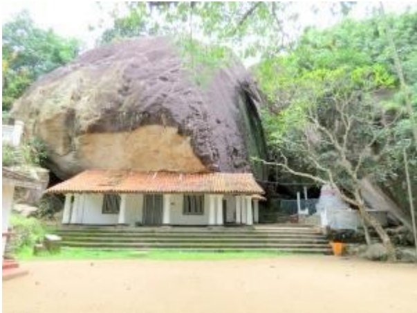
ලෙන් විහාරය හා වෙතය

විහාර භූමිය ඇතුලට ගමන් කිරීමෙන් පසු දකුණු අත දෙසින් කළුගලක් මත පිහිටුවා ඇති සන්ථාර කුළුනක් ඉංග්‍රීසි, ඕලන්ද, මහනුවර යුග වලට අයත් සංඝ ආවාස ගෙවල් දක්නට ඇත. ඒ දෙසට ගමන් කර මහනුවර යුගයේ ලෙන් ආවාස අතරින් ගියවිට ඉපැරණි දැවමය පාලම හමු වේ. ඊට ඔබ බෙත් පැරණි වැව දක්නට ලැබේ. ආපසු හැරී විහාරස්ථානයට ඇතුළු වූ ස්ථානයට ගමන් කිරීමේදී ධර්ම ශාලාව හා පැරණි පොකුණ දක්නට ලැබේ. භූගත ජල මාර්ගයක් ඔස්සේ මෙම පොකුණට ජලය ලැබෙන බවට කියවේ. ඉන්පසු හමුවන්නේ ඉපැරණි “කුමර, කුමරි” බෝධීන් වහන්සේ දෙනමයි. මින් විශාලව කෙලින් වැඩුණු බෝධිය “කුමර බෝධිය” ලෙසත් අනෙක “කුමරි බෝධිය” ලෙසත් හඳුන්වයි.