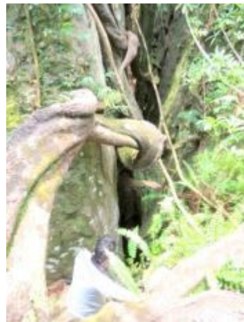
යෝධ පුස් වැල

මෙම පෙත්මග ඔස්සේ ගිය විට යෝධ පුස් වැල, සෙල්ලිපි හා කලින් සඳහන් කල බැලුම් ගලටද පිවිසිය හැකි වේ. ටික දුරක් ගමන් කරන ඔබට විශාල පුස් වැල් ගල් ලෙන් වලට උඩින් විහිදී යනු දැකිය හැක. එම ප්‍රදේශයේදීම ප්‍රධාන යෝධ පුස් වැල දැකිය හැක. මෙය වසර 400කට වඩා පැරණි බවට සැලකෙන අතර කදේ වටප්‍රමාණය අඩි