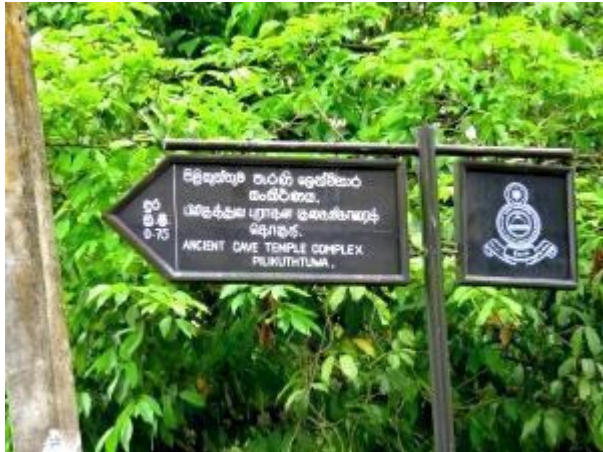
පුරාවිද්‍යා දෙපාර්තමේන්තුවේ මග පෙන්වන පුවරු

බෞද්ධ විහාරස්ථානයක් නිසා සංචාර සුදු ඇළුමකින් සැරසී මෙම ස්ථානයට යන්න. ඔබ වාහනයකින් පැමිණෙන්නේ නම් එය විහාරස්ථානය ඉදිරිපිට පොල්වත්ත අසල නතර කල යුතුය. ඉන් පසු මෑතකාලීනව ඉදි කරන ලද විශාල තොරණ අසලින් විහාරස්ථානයට ඇතුළු විය හැක. ඔබට මුලින්ම ඇස ගැටෙනු ඇත්තේ පුරාවිද්‍යාත්මක වටිනාකමක් ඇති බව හඟවන නාම පුවරු කිහිපයයි. මෙහිදී ඔබ මතක තබා ගත යුතු විශේෂතම කරුණක් වනුයේ මෙම භූමිය පුරාවිද්‍යා රක්ෂිතයක් හා වෘක්ෂ අභයභූමියක් බැවින් යම් යම් සීමා පනවා තිබිය හැකි බවයි. ඡායාරූප ගැනීමේදී , යම් උපකරණ ගෙන යාමේදී, ඇතැම් ස්ථාන වලට ඇතුළු වීමට පවා නිසි අවසරයක් අවශ්‍යවීම ආදී සීමාවන් පැවතිය හැක. වනාන්තරය තුලට පොලිතින් ගෙනයාම සපුරා තහනම්ය.