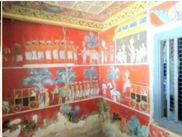
විහාර ගෙය ඇතුළත බිතුසිතුවම්

විහාර ගෙයින් පිටතට පැමිණ කුඩා වෛතයය අසලින් උඩට ගිය විට නැවත දැවැන්ත ලෙනක් හමුවන අතර ඒ අතරින් ඉහලට ගමන් කල යුතුය. මෙතැන් සිට සෑම දෙසින්ම පැරණි ගල් ලෙන් හමු වන අතර සමහර ලෙන් මැටි බිත්ති බැඳ කාමර සේ ආවරණය කර තිබෙනු දක්නට ඇත. නමුත් එම බිත්ති ගරා වැටී ඇත. ගස් වැල් සහිත වන පෙනේ ඉහලටම ගමන් කල විට "දබිනි" ලෙන ආසන්නයෙන් විශාල එළිමහන් ගල් තලාවකට පිවිසේ. මෙහි ජලය පිරුණු කුඩා පොකුණක් දක්නට ඇති අතර මෙම ගල් තලාවට ඇත ක්ෂිතිජය තෙක් විහිදෙන මනස්කාන්ත දර්ශණ තලයකින් යුක්තය. මෙම ගල්තලාව අවට පතොක් වැනි ශාඛ දක්නට ඇති අතර වනාන්තරය තුලින් නැගී සිටින අමුතු රටාවන් සහිත ගල් පර්වතද දක්නට ලැබේ. නැවත වනාන්තරය තුලට පිවිස ගමන් කිරීමේදී ඔබට විවිධ වර්ග වල පක්ෂීන් මුණ ගැසෙනු හෝ හඬ ඇසෙනු ඇත. මෙහිදී අපට ලංකා සැලලිහිණි පක්ෂීන් කිහිප දෙනෙකුම හොඳින් බලා ගැනීමට හැකි විය.