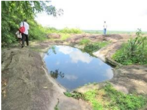
කුඩාපොකුණක් සහිත ගල් තලාව

විහාර ගෙයින් පිටතට පැමිණ කුඩා වෛතයය අසලින් උඩට ගිය විට නැවත දැවැන්ත ලෙනක් හමුවන අතර ඒ අතරින් ඉහලට ගමන් කල යුතුය. මෙතැන් සිට සෑම දෙසින්ම පැරණි ගල් ලෙන් හමු වන අතර සමහර ලෙන් මැටි බිත්ති බැඳ කාමර සේ ආවරණය කර තිබෙනු දක්නට ඇත. නමුත් එම බිත්ති ගරා වැටී ඇත. ගස් වැල් සහිත වන පෙනේ ඉහලටම ගමන් කල විට "දබිනි" ලෙන ආසන්නයෙන් විශාල එළිමහන් ගල් තලාවකට පිවිසේ. මෙහි ජලය පිරුණු කුඩා පොකුණක් දක්නට ඇති අතර මෙම ගල් තලාවට ඇත ක්ෂිතිජය තෙක් විහිදෙන මනස්කාන්ත දර්ශණ තලයකින් යුක්තය. මෙම ගල්තලාව අවට පතොක් වැනි ශාඛ දක්නට ඇති අතර වනාන්තරය තුලින් නැගී සිටින අමුතු රටාවන් සහිත ගල් පර්වතද දක්නට ලැබේ. නැවත වනාන්තරය තුලට පිවිස ගමන් කිරීමේදී ඔබට විවිධ වර්ග වල පක්ෂීන් මුණ ගැසෙනු හෝ හඬ ඇසෙනු ඇත. මෙහිදී අපට ලංකා සැලලිහිණි පක්ෂීන් කිහිප දෙනෙකුම හොඳින් බලා ගැනීමට හැකි විය.