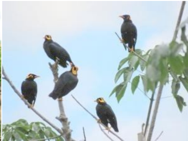
ලංකා සැලලිහිණි සමූහයක්