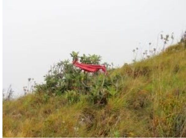
කඳු පන්තියේ අවසානය දැක්වෙන කොඩිය?

අපගේ නවක සගයින් එම කඳු මුදුනේ විවේක ගන්නා අතරේ ඇරුණ, සඳුන්, ලසිත සහ මම ඉතිරි කඳු මුදුනක් තරණය කිරීමට පිටත් විය. වන ලැහැබක් තුළින් විහිදී ඇති අඩි පාර ඔස්සේ ගමන් කර අවසාන කඳු මුදුනටද පිවිසුනෙමු. එයින් සැහීමකට පත් නොවූ අප මෙම කඳු පන්තියෙන් ඔබ්බට තවදුරටත් ගමන් කළෙමු. රතු පැහැති කොඩියකින් දක්වා තිබූ පරවියන්ගල සීමාව පසුකර බලනොඩුව කන්ද දෙසට දිවෙන වෙනත් කන්දක් වෙත පිය නැගුවෙමු. මේ අවස්ථාවේදී මීදුම අප සිටින කඳු ක්‍රමයෙන් වසා ගන්නට විය. වැහි වලාකුළින් බරවූ අහස ගිගුරුම් දෙන්නට විය. මල් තුහිනද ඇද හැලෙන්නට විය. ලසිත තවමත් අප සිටි කඳු මුදුනට සෙමෙන් ලඟා වෙමින් සිටි නිසා අප තිදෙනා සන වනාන්තරය තුළින් බලනොඩුව දෙසට ඇති මිලභ කඳු මුදුනක් ජයගැනීමේ අදහසින් පිටත් වූනෙමු.