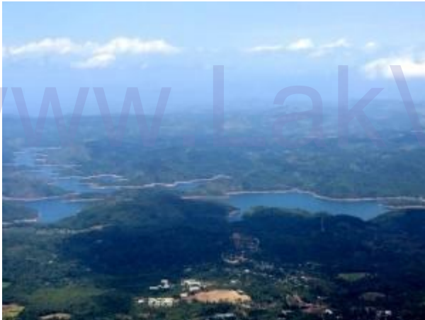
සමනල වැව, සබරගමුව විශ්ව විද්‍යාලය

එම අවස්ථාවේ ඉතා පැහැදිලි කාලගුණ තත්වයක් පැවතුනත් හොර්ටන් තැන්න ඇතුළු එම කඳු වල ඉහල කොටස මිදුමින් වැසි තිබූ නිසා මා ඉතා ආශාවෙන් පසු වූ ලෝකාන්තය සහ එහි නැරඹුම් ස්ථානය, පරවියන්ගල මත සිට ජායාරූප ගත කර ගැනීමට නොහැකි විය. රත්නපුර දිස්ත්‍රික්කයේ බලංගොඩ මැතිවරණ කොට්ඨාශයට අයත් නන්ජේරියල් වතු යායත් එහි තේ කර්මාන්ත ශාලා ගොඩනැගිලිත් මනාව දර්ශනය විය. එසේම නැග් රැක් වත්ත සහ ඒ ඔස්සේ දිවෙන මාර්ගයද හොඳින් දැක ගැනීමට ලැබිණි.