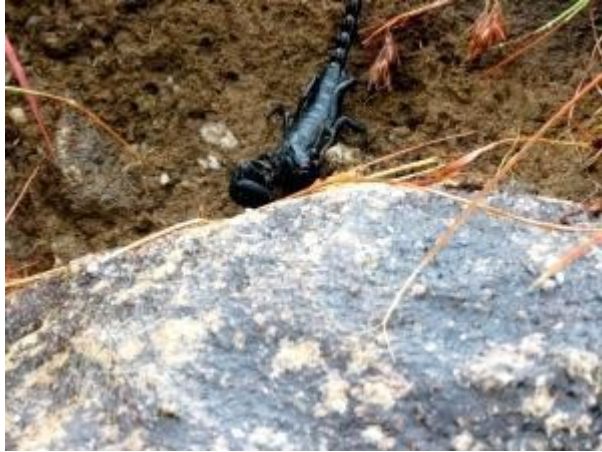
මා හට දෂය කිරීමට උත්සහා කල ගෝත්‍රස්සෙකු