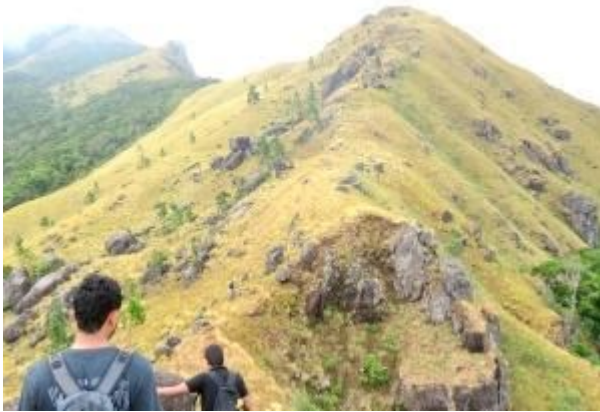
සුළං කපොල්ල පසුකරමින්