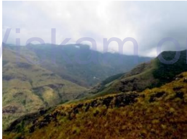
නන්ජේරියල් හා මිදුමෙන් වැසි ඇති ලෝකාන්තය

විනාඩි 45ක් පමණ පරවියන්ගල මත කාලය ගත කල අප කඳු පන්තියේ ඉතිරි කඳු මුදුන් වෙත යාමට පිටත් වූනෙමු. මේ අතර වර්ෂාවක පෙර නිමිති ක්‍රමයෙන් පහල වන්නට විය. මිලඟ කඳු මුදුනෙන් පසු හමු වන්නේ තරමක් පටු ස්වභාවයකින් යුත් දෙපැත්තෙන්ම දළ බෑවුම් සහිත සුළං කපොල්ලකි. එදින එහි තද සුළඟක් නොවූයෙන් එම ස්ථානය පසු කල අප තියුණු නැගීමකින් පසු ක්‍රමයෙන් තෙවැනි කඳු මුදුනටද ලඟා විය.