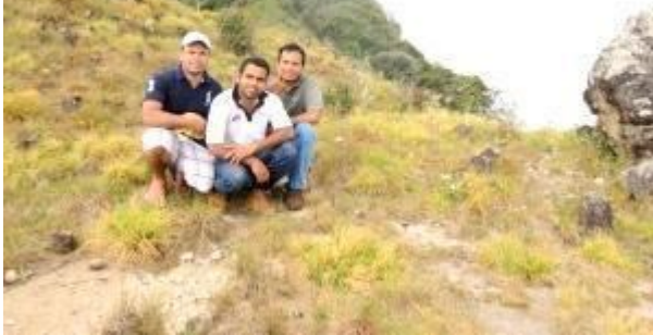
මිලභ කඳුමුදුනට යාමට පෙර