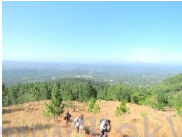
අවට සුන්දරත්වය හා තරමක් අපහසු නැගීම

අප කණ්ඩායමේ සිව් දෙනෙකුට මෙය සිය ප්‍රථම කඳු නැගීම වූ නිසා ගමන මදක් හෙමින් සිදු විය. මෙම කන්දට නිල වශයෙන් පරවියන්ගල යන නාමය භාවිතා කළත් විශ්ව විද්‍යාල ශිෂ්‍ය ප්‍රජාව අතර භාවිතා වන්නේ "ආදර කන්ද" යන නාමයයි. පරෙයියන්ගල, පරෙයිගල යන නාමයන්ද මෙම කන්දට භාවිතා කර ඇත. විශේෂයෙන් සබරගමුව විශ්ව විද්‍යාල ශිෂ්‍ය ශිෂ්‍යාවන් මෙම කන්ද නැගීම පිය වශයෙන් සිදු කරයි. හත්තන කන්ද මෙන් ශ්‍රී ලංකාවේ අනෙකුත් විශ්ව විද්‍යාල සිසුන්ද මෙය තරණයට නැඹුරුවක් දක්වයි. මෙම කන්දේ තවත් විශේෂත්වයක් නම් ෆයිනස් කැලැවෙන් පසු කොටස බොහෝ විට එළිමහන් වටපිටාවක් වන අතර, අතරින් පතර අලුතින් වැඩිගෙන එන ෆයිනස් ගස් දක්නට ඇත. එළිමහන් තෘණ භූමිය මතින් ගමන් කරන විට අවට පරිසරයේ සුන්දරත්වය මනාව දිස් වේ. නිරිතදිග දෙසින් භාවාගල කන්ද, දකුණුදිග දෙසින් සමනල වැව ජලාශය, සබරගමුව විශ්ව විද්‍යාලය, වලවේ ගං මීටියාවන හා ගිනිකොණදිග දෙසින් කුරගල ප්‍රදේශය ඒ අතරින් ප්‍රධාන වේ. අතරමගදී කදවුරු බැදීමට සුදුසු ස්ථානයක් හමුවන අතර ඊට නුදුරින් කන්ද පහලට විහිදී යන පටු වනාන්තර තීරුවක් තුලින් කුඩා ජල පහරක්ද කන්ද පහලට ගලා යයි. ඔබට හමුවන අවසාන ජල මූලාශ්‍රය මෙයයි.