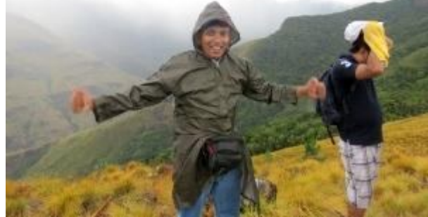
වර්ෂාව නිසා ගමන අත්හැර ආපසු පැමිණෙමින්

වනාන්තරය තුළින් ටික දුරක් ගිය අපට ගමන සාර්ථක නොවන බව හැඟී ගියේ අහස ගිගුම් දෙන්නට විමත්, පොදු වැස්සක් ඇද හැලෙන්නට විමත් හා මීදුම කැලෑව වසා ගන්නට විමත් නිසාය. ප.ව. 1.15ට පමණ ගමන අත්හැර ආපසු පෙර කඳු මුදුනට පැමිණි විට පොදු වැස්ස ක්‍රමයෙන් වැඩි වන්නට විය. අප සිටිදෙනා හැකි ඉක්මනින් ආපසු අප සගයන් රැඳී සිටින කඳු මුදුන වෙත ගමන් කළෙමු. මේ අතරතුර වර්ෂාව තදින් ඇද හැලෙන්නට විය. වැහි කබා වලින් ආරක්ෂා වූවත් තෙත බරිත වූ අප සගයන් සිටි කඳු මුදුනට ළඟාවත්ම වර්ෂාව මදක් සමනය විය. ආහාර ගනිමින් මද වෙලාවක් එහි ගත කරන විට නැවත වර්ෂාවක පෙර නිමිති පහළවිය. ප.ව. 2.00ට කන්දෙන් බැසීම ආරම්භ කල අපට අතරමගදී නැවත තද වර්ෂාවකට හා සිතල සුළඟට මැදිවන්නට සිදු විය. ඉතා සෙමින් හා සිරුවෙන් කන්ද බැසීම සිදුකල අපට අමිල සහෝදරයාගේ දණහිසේ ආබාධයක් හටගත් නිසා වැස්සේ තෙමෙමින් ඔහුට බැසීමට උදව් දෙමින් ඉතාමත් සෙමින් කන්ද බැසීමට සිදු විය. මේ අනපේක්ෂිත සිදුවීම සහ විටින් විට හටගත් තද වැස්ස නිසා අපට සිහු බැවුම් වලින් පහලට බැසීමට නොසිතූ විරූ වෙලාවක් ගත විය.