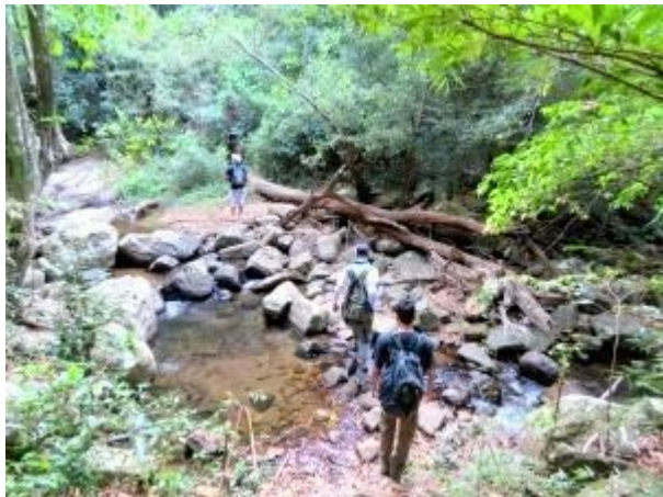
දොළ පහර පසු කර උසින් කැලෑවට

කුඩා දොළ පහරක් හමුවන ස්ථානයකින් දකුණට හැරී කැලෑබද මාර්ගය ඔස්සේ දිගටම ගමන් කල විට වනගත හික්ෂු ආරාමයක් හමුවේ (මෙම ආරාමයේ භාවනායෝගීව වැඩවසන හික්ෂුන් වහන්සේට බාධා නොවන අයුරින් හැසිරීමට වග බලා ගන්න). එම ආරාමයට පසෙකින් දොළ පහරක් ගමන් කරන අතර වැසිකිලියක් අසලින් දකුණු පසට හැරී දිය පහර මතින් උසින් කැලෑවට ඇතුළු විය යුතුය. මෙතැන් සිට කන්ද මුදුන දක්වාම අඩි පාර දක්නට ඇති අතර ඒ ඔස්සේ මග පෙන්වන්නකු නොමැතිව වුවද කන්දට ගමන් කල හැක. පයින් කැලෑව අවසන් වන ස්ථානයේදී උදෑසන ආහාරය ගත් අප මද විවේකයක් ලබා ගත්තෙමු.