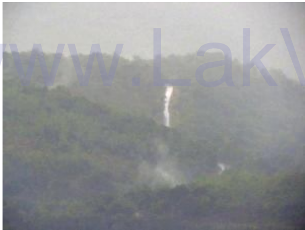
අපව මුළා කල දිය ඇල්ල

අප කන්ද නගිද්දී දක්නට නොවූ දිය ඇලි වර්ෂාව නිසා නිර්මාණය වී පරිසරයට අමුතූම අලංකාරයක් එක් කර තිබුණි. සබරගමු විශ්ව විද්‍යාලය හා සමනල වැව ජලාශයට ඉහලින් ඉතා ඇතින් වූ කන්දක වනාන්තරයක් තුලින් කලින් අප ඇස නොගැටුණු ඉතා අලංකාර දිය ඇල්ලක් දැක අප සියලු දෙනාම පුදුමයට පත් වීමු. එය ඉතා උසින් හා පළලින් යුතු විශාල ඇල්ලක් බව බැලූ බැල්මට පෙනිණි. මාගේ කැමරාවට පින් සිදු වන්නට zoom කර ලබා ගත් ඡායාරූප පෙළක් පසුව පිරික්සීමේදී එය දිය ඇල්ලක් නොව ජලය වැටී දිලිසෙන මාර්ගයක් බවට හඳුනා ගන්නා ලදී.