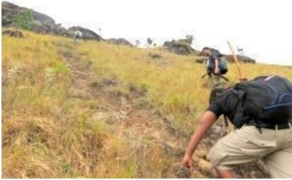
අංශක 75ක පමණ ආනතියකින් යුත් දුෂ්කර නැගීමක්