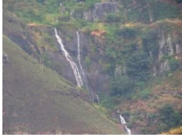
වැස්ස දිය ඇල්ලකට පන ලබා දී...

අප කන්ද නගිද්දී දක්නට නොවූ දිය ඇලි වර්ෂාව නිසා නිර්මාණය වී පරිසරයට අමුතූම අලංකාරයක් එක් කර තිබුණි. සබරගමු විශ්ව විද්‍යාලය හා සමනල වැව ජලාශයට ඉහලින් ඉතා ඇතින් වූ කන්දක වනාන්තරයක් තුලින් කලින් අප ඇස නොගැටුණු ඉතා අලංකාර දිය ඇල්ලක් දැක අප සියලු දෙනාම පුදුමයට පත් වීමු. එය ඉතා උසින් හා පළලින් යුතු විශාල ඇල්ලක් බව බැලූ බැල්මට පෙනිණි. මාගේ කැමරාවට පින් සිදු වන්නට zoom කර ලබා ගත් ඡායාරූප පෙළක් පසුව පිරික්සීමේදී එය දිය ඇල්ලක් නොව ජලය වැටී දිලිසෙන මාර්ගයක් බවට හඳුනා ගන්නා ලදී.