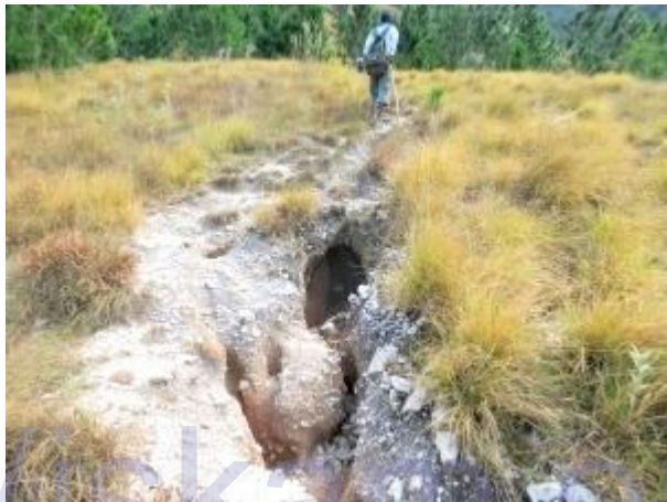
නිරුවානා ගල් සහිත සේදී ගිය අඩි පාර

මෙසේ නියුණු නැගීමත් සහිත ප්‍රදේශ පසු කරමින් මද විවේකයන් ලබා ගනිමින් දහවල් 11.15 වන විට "ආදර කන්ද" කළු ගල් පර්වතයට ලඟා වීමට අපට පැය 4ක් පමණ ගත විය. මුහුදු මට්ටමේ සිට එම ස්ථානයේ උස මීටර් 1451ක් ලෙස අපගේ වන්දිකා GPS උපකරණයේ සටහන් විය. මෙම පර්වතය මත සිට ගත්විට අවට දර්ශන තල මැනවින් දැක ගත හැකි විය. කලින් සඳහන් කල දර්ශන තල වලට අමතරව මෙම කඳු පන්තියේ මුදුනත් බලනොඩුව කන්ද දෙසට විහිදී යන අකාරය මනාව දර්ශනය වන්නට විය. පරවියන්ගල කඳු පන්තියේ ප්‍රධාන කඳු මුදුන් සතරක් ඊසානදිගින් පිහිටා ඇති බඹරකන්ද දෙසට වන්නට ඇති බලනොඩුව, ගොම්මෝලි කඳු වලට එකට සම්බන්ධව පිහිටා ඇත. මෙම කඳු මුදුන් සහ සන වනාන්තරය මනාව දැක බලාගත හැකි අතර වයඹදිග දෙසින් මහළුය (හොර්ටන් තැන්න) අයත් ඉතා උස් කඳු ප්‍රදේශය මැනවින් දර්ශනය වේ. මෙම කඳු අතරින් කිරිකැටි ඔය ද ගලා බසී.