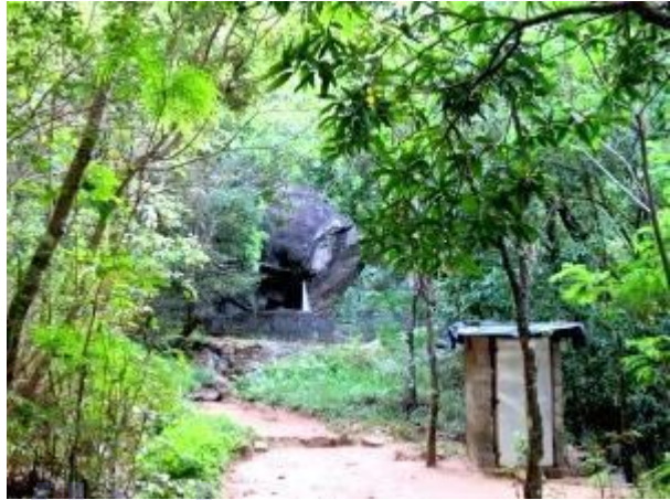
වනගත ආරාමය. වැසිකිලිය අසලින් දකුණට හැරෙන්න

කුඩා දොළ පහරක් හමුවන ස්ථානයකින් දකුණට හැරී කැලෑබද මාර්ගය ඔස්සේ දිගටම ගමන් කල විට වනගත හික්ෂු ආරාමයක් හමුවේ (මෙම ආරාමයේ භාවනායෝගීව වැඩවසන හික්ෂුන් වහන්සේට බාධා නොවන අයුරින් හැසිරීමට වග බලා ගන්න). එම ආරාමයට පසෙකින් දොළ පහරක් ගමන් කරන අතර වැසිකිලියක් අසලින් දකුණු පසට හැරී දිය පහර මතින් උසින් කැලෑවට ඇතුළු විය යුතුය. මෙතැන් සිට කන්ද මුදුන දක්වාම අඩි පාර දක්නට ඇති අතර ඒ ඔස්සේ මග පෙන්වන්නකු නොමැතිව වුවද කන්දට ගමන් කල හැක. පයින් කැලෑව අවසන් වන ස්ථානයේදී උදෑසන ආහාරය ගත් අප මද විවේකයක් ලබා ගත්තෙමු.