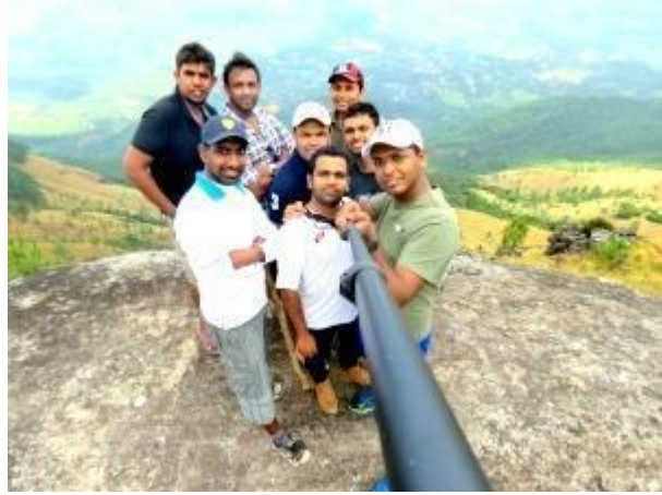
පරවියන්ගල මත සෙල්ලි සමූහ ජායාරූපය

එම අවස්ථාවේ ඉතා පැහැදිලි කාලගුණ තත්වයක් පැවතුනත් හොර්ටන් තැන්න ඇතුළු එම කඳු වල ඉහල කොටස මිදුමින් වැසි තිබූ නිසා මා ඉතා ආශාවෙන් පසු වූ ලෝකාන්තය සහ එහි නැරඹුම් ස්ථානය, පරවියන්ගල මත සිට ජායාරූප ගත කර ගැනීමට නොහැකි විය. රත්නපුර දිස්ත්‍රික්කයේ බලංගොඩ මැතිවරණ කොට්ඨාශයට අයත් නන්ජේරියල් වතු යායත් එහි තේ කර්මාන්ත ශාලා ගොඩනැගිලිත් මනාව දර්ශනය විය. එසේම නැග් රැක් වත්ත සහ ඒ ඔස්සේ දිවෙන මාර්ගයද හොඳින් දැක ගැනීමට ලැබිණි.