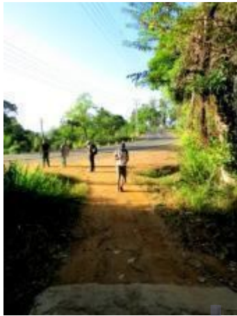
ගමන ආරම්භ වන කුඩා මාර්ගය

වසරකට වැඩි කාලයක් මා විසින් විවිධ අවස්ථාවල ගත් උත්සාහයන් එල දරමින් පරවියන්ගල කන්ද තරණයට 8 දෙනෙකුගේ කණ්ඩායමක් සුදානම් කර ගන්නා ලදී. අගෝස්තු 15 වන සෙනසුරාදා අළුයම 2.40 ට පිටකොටුවෙන් පිටත්වන (99) බදුල්ල - කොළඹ බසයෙන් ගමන් ආරම්භ කල අප පහතීන්තෙන් උදෑසන 7ට බැස ගත්තෙමු. මහාමාර්ගය ඔස්සේ බදුල්ල දෙසට මීටර් 300ක් පමණ ඇවිදගෙන ගොස් විශාල වංගුවක් සමග වම් පසින් ඇතුලට විහිදෙන Interlock ගල් අල්ලන ලද කුඩා මාර්ගයකින් ඇතුල් විකෙලින්ම ඇති මාර්ගයේ ඉහලට ගමන් කල යුතුය.