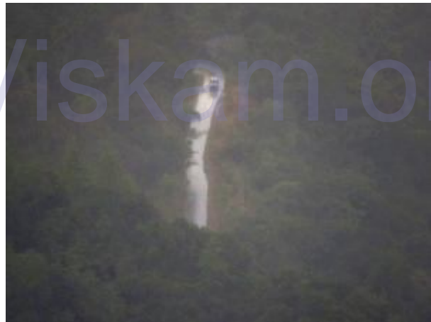
සත්‍යය පසක් වී... දිලිසෙන මාර්ගය

වැස්සට තෙත බරිත වූ සපත්තු හා ඇඳුම් බොහෝ වෙලාවක් හැද පැළද ගෙන සිටීම නිසා ශරීරය හා කකුල් තැම්බී සුදුමැළී වී තිබිණ. අප වනගත ආරාමය අසල දොළ පාර පසු කරන විට කළු වර වැටෙමින් තිබිණ. ඉතිරි කොටස පසු කරමින් සිටියදී තද අඳුර හා තද වර්ෂාවට මැදි වී රාත්‍රී 7.00 වනවිට බදුල්ල-කොළඹ මහා මාර්ගය වෙත ලඟ වුනෙමු. දහවල් ආහාරයවත් හරි හැටි නොලැබුණු අප කොළඹ බසයකට ගොඩ වී නිවෙස් බලා පිටත් වුනෙමු. පැය 12ක වෙහෙසකර පා ගමනකින් පසුව කිසිදු කරදරයකින් තොරව නිවෙස් බලා යාමට සියලු අප දෙනාටම හැකි විය. එදින ලබා ගත් අත්දැකීම් වලින් ප්‍රබෝධමත් වූ අප සියළුම දෙනා මිළඟ අභියෝගය ජය ගැනීමට පුලපුලා බලා සිටින්නෙමු.