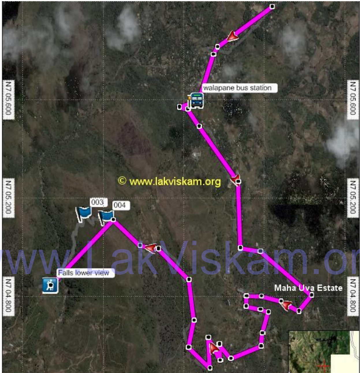
මහ උව වන්නේ සිට දිය ඇල්ලට යන මාර්ගය

මෙම ලිපියේ අයිතිය “ලක් විස්කම්” වෙබ් අඩවිය සතුය. © www.lakviskam.org.