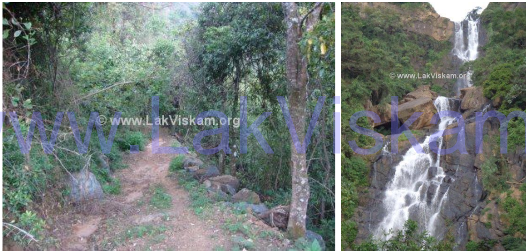
වන ලැහැබ හා දිය ඇල්ල

මාර්ගය ඔස්සේ දිගටම යාමේදී ඔබට වන ලැහැබක් හමු වනු ඇත. එය පසුකල විට ගල් කඩා විනාශ කරන ලද විශාල ගල්තලාවක් ඇති පෙදෙසක් හමු වේ. එයද පසු කල විට ඔබට දිය ඇල්ලේ පහළ කොටස හොදින් දර්ශණය වනු ඇත.