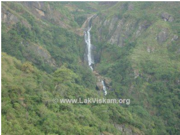
දුරට පෙනෙන දිය ඇල්ල