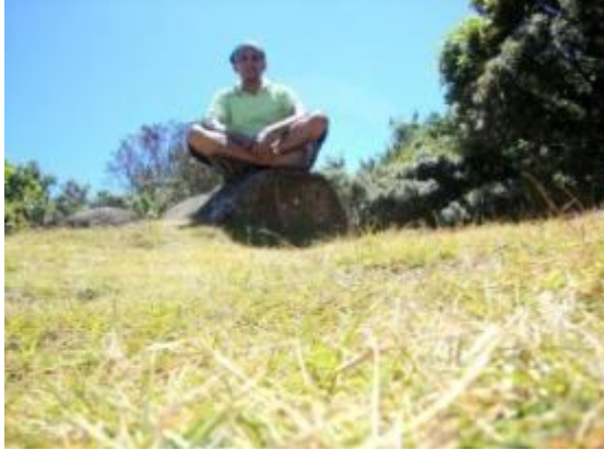
දෙවනඋස් කඳුමුදුනේ උස්ම ස්ථානයේ ගිමන් හරිමින්