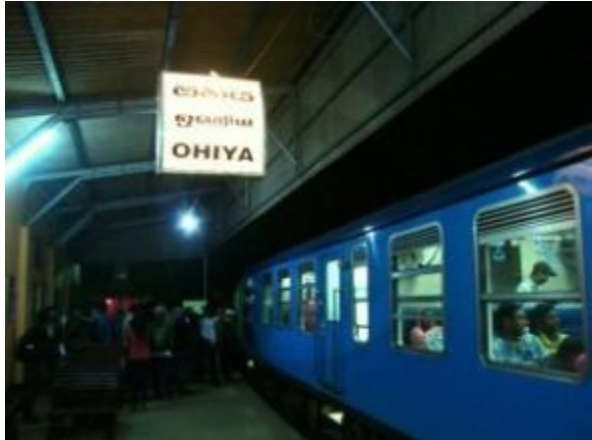
අලුයම 4.15-ඔහිය දුම්රිය ස්ථානය

ස්ථානයේ ගත කළෙමු. මේ අතර වාරයේ දුම්රිය ස්ථානයට ඉදිරියෙන් ඇති ගාමිණීගේ කඩය විවෘත කරන ලදී. අප වහා ඒ දෙසට ගියේ උණුවෙන් තේ කෝප්පයක් බීමටය. රොට් කා උණු තේ කෝප්පයකින් සප්පායම් වූ අපට මහළුය දක්වා යාමට ත්‍රිරෝද රථයක් කඩයේ මුදලාලි විසින් සූදානම් කර දෙන ලදී. තවමත් කරුවල නිසා ටික වේලාවක් ඔහිය ගමේ ගත කල අප අලුයම 5.15ට පමණ ත්‍රිරෝද රියෙන් කරුවලේම පිටත් වූයෙමු. රථයේ රියදුරා අතරමග වූ පත්තිනි දේවාලයට පහනක් පත්තුකර කන්ද නැගීම ආරම්භ කලේය.