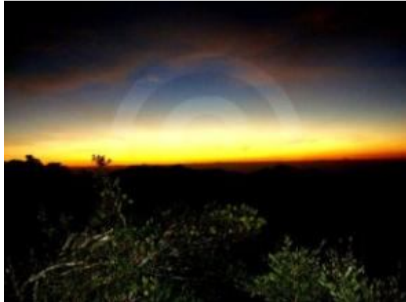
මහළුයට හිරු උදා වීමට මොහොතකට පෙර

දවසේ මුල්ම හිරු රැස් මහළුයට පතිතවන වමන්කාරය විඳ ගැනීමට අපි වාසනාවන්ත වූයෙමු. මෙම ගමනට මාස කිහිපයකට පෙර සිටම සූදානම් වූ අපි හෝර්ටන් තැන්න භූමියේ කඳවුරු බිමක් බත්තරමුල්ලේ වනජීවී කාර්යාලයෙන් වෙන් කොට තබා ගත්තෙමු. ඊට අදාල ලියකියවිලි ඇතුල්වීමේ ගේට්ටුවට ඉදිරිපත් කිරීමෙන් නැවත ප්‍රවේශපත්‍ර මිලදී ගැනීමකින් තොරව හෝර්ටන් තැන්නට ඇතුළු වියහැකි විය. ප්‍රධාන කාර්යාලය වෙත ගමන් කරන අතරතුර හිරු එළිය කෙමෙන් තැන්නට පතිත වන්නට විය. තැන්නේ සිටි විශාල ගෝනුන් රංචුවක්ද ජායාරූපයට නැගීමට අපට හැකි විය. ප්‍රධාන කාර්යාලයට මුලින්ම පැමිණියේ අප තිදෙනාය. ඒ අවස්ථාවෙන් ප්‍රයෝජන ගත් අපට කඳවුරු භූමියේ හොදින් පිරිසිදුව පවත්වාගෙන යන වල වැසිකිලි නිදහසේ පාවිච්චි කලහැකි විය. මද වෙලාවක් ගතවෙත්ම කාර්යාල භූමිය සංචාරකයන්ගෙන් පිරියන්නට විය. අප එහි නිලධාරීන් සමග කතාබහ කර කුඩාරම ඇතුළු අනිකුත් අමතර බඩු කාර්යාල බිමේ ආරක්ෂිත තැනක තබා කිරිගල්පොත්ත නැගීමෙන් පසු කඳවුරු බිමේ කුඩාරම් ගැසීමේ බලාපොරොත්තුවෙන් ගමනට අවශ්‍ය ඇදුම් ඇද ගනිමු. විශේෂයෙන් තැන්නේ ඇති 'යුරෝපීය කටු පදුරු' නම් ආක්‍රමණික කටු පදුරු විශේෂය නිසා කකුල් වැසෙන ඇදුමක් ඇද සිටීම වැදගත් වේ. කාර්යාල භූමියේ කිරිගල්පොත්ත කන්ද පිහිටා ඇති දිශාව හා විස්තර පුවරුවක දක්වා ඇත. එහි සිට කන්දට දුර 7km පමණ වේ. එනම් සම්පූර්ණ ගමනේ දුර 14 km පමණ වේ.