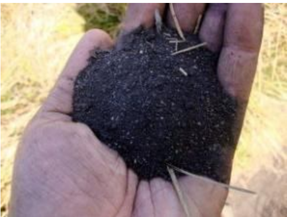
කළු පැහැති හියුමස් පස

තවත් ඉදිරියට යද්දී කුරු බට පදුරු සහිත කැලෑ පෙදෙසක් හමු වේ. මෙම වනාන්තරය තුල දිවියන්ගේ හා ගෝනුන්ගේ අඩි සලකුණු දක්නට ලැබුණු අතර වනාන්තරය පුරාම තැනින් තැන වළි කුකුලන් තරගයට මෙන් කෑ ගසනු අසන්නට ලැබුණි. වළිකුකුලන් සැගවෙමින් කෑ ගැසීමට රුචි නිසා පැහැදිලිව දැක බලා ගැනීමට තරමක් අපහසුය. වනාන්තරය පුරා තෙළු මල් පොහොට්ටු දක්නට වූ අතර වළි කුකුලන් මෙම තෙළු මල් ආහාරයට ගැනීමට ප්‍රිය කරයි. අධික ලෙස තෙළු මල් සහ එහි ඇට ආහාරයට ගත් විට වළි කුකුලන් මත්වී බිම වැටී සිටී. මීට මාස කිහිපයකට පෙර මුළු හෝර්ටන් තැන්න පුරාම අධික ලෙස තෙළු මල් පිපී තිබූ අවස්ථාවේ මෙය සුලබ දසුනක්