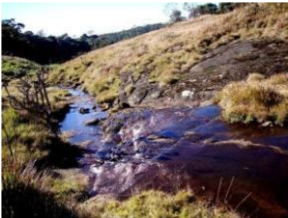
වලවේ ගහ බලා යන දිය පහර

හිරු නැගෙත්ම එතෙක් පැවැති තද ශීතලද ක්‍රමයෙන් පහව යන්නට විය. කලින් සඳහන් කල කටුපදුරු නිසා සුළු සිරිමි තුවාල ලබා එම ප්‍රදේශ පසු කල අප එළිමහන් තැන්න පසු කර වනාන්තර ප්‍රදේශයකට ඇතුළු වූයෙමු. එක්වරම අප අසලින් සතෙකු කෑ ගසන රළු මහා ශබ්දයකින් අප තිගැස්සී ගියෙමු. ඒ ගෝනකු බවට අපට අවබෝධ විය. ශබ්ද නොනගා ඉතා සුක්ෂ්ම ලෙස ඒ දෙසට බඩ ගා ගියේ එම ගෝනා සමීප ජායරූපයකට හසු කර ගැනීමටයි. එහෙත් ඔවුන් අපට වඩා සංවේදී නිසා එක්වරම ගෝනුන් රංචුවක් කැලෑව ඇතුලට ක්ෂණිකව දුව ගියේ අපවද බියට පත් කරවමිනි. නැවත ඉදිරියට ඇදුනු අපට මී වදයකින් නැගෙන්නාක් වැනි ශබ්දයක් ඇසෙන්නට විය. නිසොල්මනේ විපරම් කර බැලුවත් ඒ ශබ්දය එන ස්ථානය සොයා ගැනීමට අපහසු විය. ඇතැම්විට එය මලකුණකට වැසූ නිල මැස්සන්ගෙන් නැගෙන හඬක් විය හැකියයි අනුමාන කළෙමු. වනාන්තර පෙදෙසෙන් එලියට ආ විට හමු වූයේ ඉතා අලංකාර බෙලිහුල් ඔය හරහා වලවේ ගහ බලා ගලා යන ජල පහරයි. එහි නොඉඳුල් සීතල ජල පොදකින් පිපාසය නිවා ගත් අපට ජල පහරට උඩින් දකුණු පසට දිවෙන අඩිපාර ඔස්සේ ඉදිරියට ඇදුනෙමු. මේ ආශ්‍රිතව තවත් පාරක් ඇති අතර එය ඔස්සේ ගමන් නොකර දකුණු පසට දිවෙන මාර්ගයේ යා යුතුය. අනෙක් මාර්ගය අතීතයේ අශ්වයින් පිටේ කැලයෙන් අනෙක් පැත්තට යාමට යොදා ගත් මාර්ගයක් යයි පැවසේ. මෙම පෙදෙසේ පස් තද කළු පැහැති වන අතර පිලිස්සුනු අමුතු හැඩයේ පාෂාණ, මැටි වැනි කොටස්ද දක්නට ලැබේ. තැන්නේ මෙම හියුමස් පස කළු පැහැගැන්වී තිබීම පිලිබදව මෙවන් අදහසක් ජනවහරේ ඇත. එනම් රාවණා - රාම යුද්ධයේදී භාවිතා කල අවි වල ප්‍රබලත්වය හේතුවෙන් මෙම පස මෙසේ පිලිස්සී කළු පැහැ ගැන්වී ඇති බවයි.