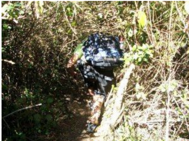
පදුරු අතරින් විහිදුන අභිපාර

විය. වනාන්තරය තුළ නිල් මොණරැස්ස, සීතා ජේර, අලිකන්, වල් කුරුදු, බෝවිටියා, වැල් කපුරු, ගිනි හොට, කුරු උණ ආදී ශාඛ දක්නට ලැබේ. පෙද පාසි, මහා රාවණා රැවුල, හරිත ඇල්ගී, කඳු ලැස්ස, හාතාවාරිය ආදියද දක්නට ඇත. නැවතත් එලිමහන් ගමන් මාර්ගයකට පිවිසි අපට කිරිගල්පොත්ත කන්ද ඇතින් දර්ශනය විය. මී වද, මහරත් මල් සුලබව දක්නට හැකි මෙම ප්‍රදේශය තුළ තවත් ඉතා අලංකාර මල් වර්ග දක්නට ඇත.