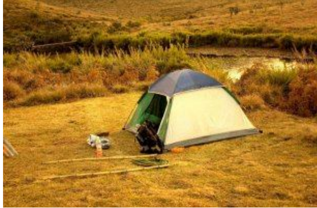
විමිනි පොකුණ අසල කුඩාරම සවිකර

එදින මුලින්ම කඳු මුදුනට ළගා වූයේ අප තිදෙනාය. අප පහලට යන විට කඳු මුදුන බලා යන තවත් කණ්ඩායම් 4ක් හමු විය. අපට පෙර කී මාර්ගය ඔස්සේම විවේක ගනිමින් හොර්ටන් තැන්න කාර්යාල භූමියට ළගාවීමට විමට සවස 3 පමණ විය. එහි ආපන ශාලාවේ කුසගිනි නිවාගැනීමට සුදුසු දෙයක් නොවූයෙන් රොටි කිහිපයක් ඇනවුම් කර පැයක් පමණ බලා සිටීමට සිදුවිය. තුලසිදාස් එහි ආපනශාලාවේ නතරකොට ලසිත හා මා සියළු බඩු බාහිරාදිය රැගෙන විමිනි ඇල්ල අසල වූ අංක 3 කදවුරු බිමෙහි අප කුඩාරම සවි කළෙමු. මෙම කදවුරු බිම ඉතාමත් අලංකාර දර්ශන තලයක් සහිත එකක් විය. මිලට ගත් රොටි කුඩාරම අසල එළිමහනේදී අනුභව කළෙමු. අනතුරුව රාත්‍රී ආහාරය පිළියෙල කිරීමට සූදානම් වූයෙමු.