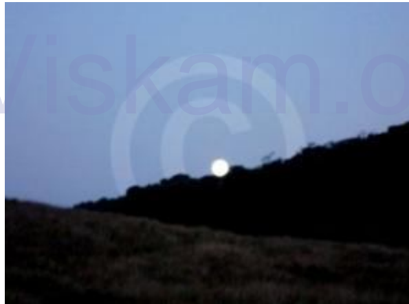
පුරහද මෝදු වෙමින්

කදවුරු භූමියේ ගිනිමැල දැල්වීම තහනම් බැවින් කොළඹ සිට ගෙන ගිය භූමිතෙල් ලිප ඒ සඳහා යොදා ගනිමු. විමිනි ඇල්ලේ අධික සීතල ජලයෙන් ඇග පත සෝදාගත් අප සීතලට ඔරොත්තු දෙන ඇඳුම් ඇද උණුසුම් තේ කෝප්පයකින් සප්පායම් වී රාත්‍රී ආහාරය සකස් කළෙමු. එදින පුරපසළොස්වක පොහොය දිනයක් වූයෙන් හද එළිය නොඅඩුව ලැබුණි. සද එළියේ කදවුරු බැදීම අපටද නවමු අත්දැකීමක් විය. රාත්‍රී 7.30 පමණ විට එතෙක් පැහැදිලිව තිබූ තැන්න මීදුමෙන් වැසී ගියේය. රාත්‍රිය අධික ශීතල සහිත වූයෙන් කුඩාරම තුල අහාර ගෙන පසු දින නොටුපල කන්ද නැගීමේ බලාපොරොත්තුවෙන් නින්දට ගියෙමු. ගෝනුන් කුඩාරම අසලින්ම කැගසන ශබ්දයන් විමිනි පොකුණේ ජලය පහලට ගලා යන ශබ්දයන් අතරේ තනිවූ අපට නින්ද ගියමුත් අධික සීතල නිසා වරින්වර අවදිවීමටත් ශීතලෙන් පීඩා විදීමටත් සිදු විය. අපගේ කිරිගල්පොත්ත තරණය මෙසේ නිමා විය.