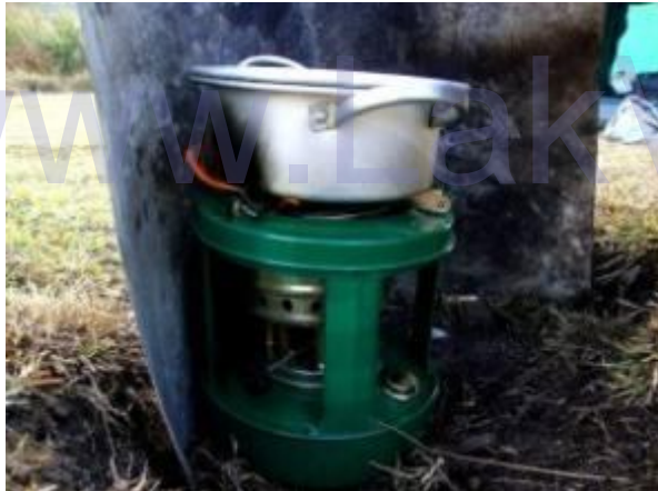
භූමිතෙල් ලිපේ රාත්‍රී ආහාරය පිසීමින්

එදින මුලින්ම කඳු මුදුනට ළගා වූයේ අප තිදෙනාය. අප පහලට යන විට කඳු මුදුන බලා යන තවත් කණ්ඩායම් 4ක් හමු විය. අපට පෙර කී මාර්ගය ඔස්සේම විවේක ගනිමින් හොර්ටන් තැන්න කාර්යාල භූමියට ළගාවීමට විමට සවස 3 පමණ විය. එහි ආපන ශාලාවේ කුසගිනි නිවාගැනීමට සුදුසු දෙයක් නොවූයෙන් රොටි කිහිපයක් ඇනවුම් කර පැයක් පමණ බලා සිටීමට සිදුවිය. තුලසිදාස් එහි ආපනශාලාවේ නතරකොට ලසිත හා මා සියළු බඩු බාහිරාදිය රැගෙන විමිනි ඇල්ල අසල වූ අංක 3 කදවුරු බිමෙහි අප කුඩාරම සවි කළෙමු. මෙම කදවුරු බිම ඉතාමත් අලංකාර දර්ශන තලයක් සහිත එකක් විය. මිලට ගත් රොටි කුඩාරම අසල එළිමහනේදී අනුභව කළෙමු. අනතුරුව රාත්‍රී ආහාරය පිළියෙල කිරීමට සූදානම් වූයෙමු.