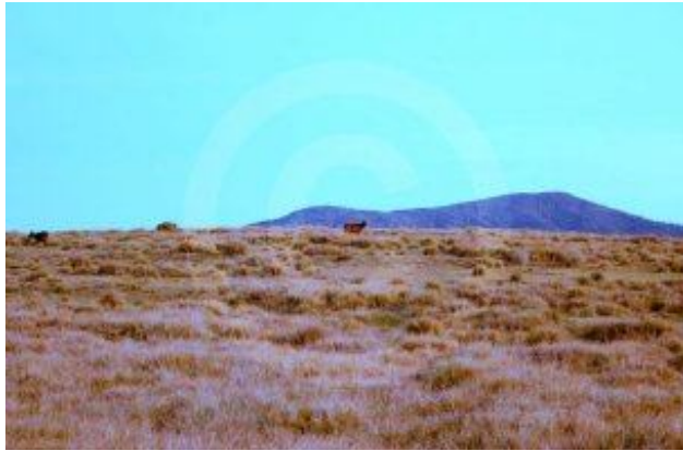
ගෝනුන් තෘණ බුදිමින්