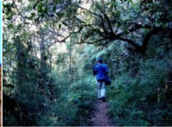
කැලය මැදින් පෙරට

හිරු නැගෙත්ම එතෙක් පැවැති තද ශීතලද ක්‍රමයෙන් පහව යන්නට විය. කලින් සඳහන් කල කටුපදුරු නිසා සුළු සිරිමි තුවාල ලබා එම ප්‍රදේශ පසු කල අප එළිමහන් තැන්න පසු කර වනාන්තර ප්‍රදේශයකට ඇතුළු වූයෙමු. එක්වරම අප අසලින් සතෙකු කෑ ගසන රළු මහා ශබ්දයකින් අප තිගැස්සී ගියෙමු. ඒ ගෝනකු බවට අපට අවබෝධ විය. ශබ්ද නොනගා ඉතා සුක්ෂ්ම ලෙස ඒ දෙසට බඩ ගා ගියේ එම ගෝනා සමීප ජායරූපයකට හසු කර ගැනීමටයි. එහෙත් ඔවුන් අපට වඩා සංවේදී නිසා එක්වරම ගෝනුන් රංචුවක් කැලෑව ඇතුලට ක්ෂණිකව දුව ගියේ අපවද බියට පත් කරවමිනි. නැවත ඉදිරියට ඇදුනු අපට මී වදයකින් නැගෙන්නාක් වැනි ශබ්දයක් ඇසෙන්නට විය. නිසොල්මනේ විපරම් කර බැලුවත් ඒ ශබ්දය එන ස්ථානය සොයා ගැනීමට අපහසු විය. ඇතැම්විට එය මලකුණකට වැසූ නිල මැස්සන්ගෙන් නැගෙන හඬක් විය හැකියයි අනුමාන කළෙමු. වනාන්තර පෙදෙසෙන් එලියට ආ විට හමු වූයේ ඉතා අලංකාර බෙලිහුල් ඔය හරහා වලවේ ගහ බලා ගලා යන ජල පහරයි. එහි නොඉඳුල් සීතල ජල පොදකින් පිපාසය නිවා ගත් අපට ජල පහරට උඩින් දකුණු පසට දිවෙන අඩිපාර ඔස්සේ ඉදිරියට ඇදුනෙමු. මේ ආශ්‍රිතව තවත් පාරක් ඇති අතර එය ඔස්සේ ගමන් නොකර දකුණු පසට දිවෙන මාර්ගයේ යා යුතුය. අනෙක් මාර්ගය අතීතයේ අශ්වයින් පිටේ කැලයෙන් අනෙක් පැත්තට යාමට යොදා ගත් මාර්ගයක් යයි පැවසේ. මෙම පෙදෙසේ පස් තද කළු පැහැති වන අතර පිලිස්සුනු අමුතු හැඩයේ පාෂාණ, මැටි වැනි කොටස්ද දක්නට ලැබේ. තැන්නේ මෙම හියුමස් පස කළු පැහැගැන්වී තිබීම පිලිබදව මෙවන් අදහසක් ජනවහරේ ඇත. එනම් රාවණා - රාම යුද්ධයේදී භාවිතා කල අවි වල ප්‍රබලත්වය හේතුවෙන් මෙම පස මෙසේ පිලිස්සී කළු පැහැ ගැන්වී ඇති බවයි.