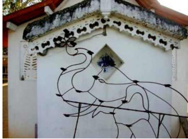
සිරිපා නැමදුම් හා නැරඹුම් කුටිය හා එහි පිටුපස කවුළුව

මෙම විහාරයට ගිනිකොන දිශාවට වන්නට කුරු ගඟ පිහිටා ඇති අතර අතීතයේදී දළදා සමිදුන්ට පූජා කිරීම සඳහා මල් ලබාගැනීමට මායාදුන්න රජු විසින් කරවූ මල් උයනක් මෙම කුරු ගඟ අසබඩ පිහිටා තිබිණි. මෙම ප්‍රදේශය එකල මල්වත්ත ඕව්ට ලෙස හඳුන්වා ඇති බවට කියවේ. අදත් මෙම විහාරස්ථානයට නුදුරින් ඇති බඩහැල් ගොඩ නම් ගම මල්වත්ත ඕව්ට ලෙස හඳුන්වයි. ජනප්‍රවාද අනුව එකල මෙම රාජකීය මල් වත්තේ මල් ප්‍රමාණය දිනෙන් දින අඩුවන බව දුටු එහි භාරකරු ඊට හේතුව සොයා ගත නොහැකිව රජුට සැල කර සිටින ලදී. රජතුමා වහා සිය සේවකයන් මාර්ගයෙන් සොයා බැලුවත් ඔවුන්ටද මල් අඩු වීමට හේතුව සොයා ගැනීමට නොහැකි විය. අවසානයේදී අඩබෙරයක් මගින් මෙය සොයා දෙන අයෙකුට වටිනා තැඟි පිරිනමන බව සැලකර සිටින ලදී. එයින් ආරම්භක ප්‍රතිඵල අත් වන බවක් පෙනෙන්නට නොතිබිණි. මල් උයන ආසන්නයේ විසූ "කොටා" යන අනවර්ථ නාමයෙන් හඳුන්වන ලද අත් නොමැති පුද්ගලයෙක්ද මේ සඳහා ඉදිරිපත් විය. ඔහු මල්වත්තේ සැඟ වී සිටින විට සුරූපී ලඳුන් කිහිප දෙනෙකු පැමිණ මල් නෙලා ඒවා මල්ලක තැම්පත් කළේලු. කොටා ලඳුන් ආපසු පිටවූ පසු ඔවුන් පසුපසින් ගියේලු. මල්ලේ වූ සිඳුරක් තුළින් මල් මහ දිගට වැටී තිබුණෙන් ඔහුට පාර සොයා ගැනීමට අපහසු නොවීය. ඔහු අවසානයේ ලඟ වූයේ සමනල කන්ද මුදුනටයි. ලඳුන් ශ්‍රී පතුලට මල් පූජා කර කොටා දෙසට පැමිණියහ. එහිදී කොටා මල් අනවසරයෙන් රැගෙන යාම ගැන විමසා සිටියේය. ඔවුන් පැවසූයේ තමන් දිව්‍යාංගනාවන් බවත් දිනපතා හිමිදිරියේ බුදු රදුන්ගේ ශ්‍රී පතුල නැමදීමට මෙම මල් ගෙන ගිය බවත් මේ පිළිබඳව රජතුමාට සැල කර සිටින ලෙසත්ය. මෙම කතාව අසූ රජතුමාටද එම මාර්ගය ඔස්සේ සිරිපා කරුණා කිරීමට සිත් විය. ඔහු ගමන් ගත් එම මාර්ගය පලාබත්ගල හරහා වැටී ඇති රත්නපුරා මාර්ගයයි. මින් පසු මෙය රජමාවන නමින්ද හඳුන්වා ඇත.