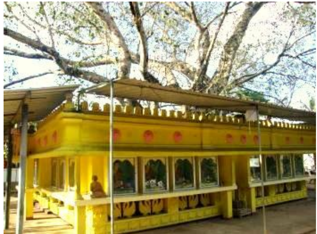
ශ්‍රීපාදය ඇතින් දිස්වෙන කඳු වලල්ල හා පුරාණ බෝධින් වහන්සේ

මෑත අතීතයේ විහාරය අවට සිදු කල පතල් කැපීම් වලදී විවිධ ප්‍රමාණ වල රත් කහවනු කිහිපයක් මතු වී ඇති අතර ඒවායේ බහිරව රූපය හා පංචායුධ රූප කොටා තිබී ඇත. වර්තමානයේ නිදන් සොරුන්ගේ පවා තර්ජනයට ලක්වී