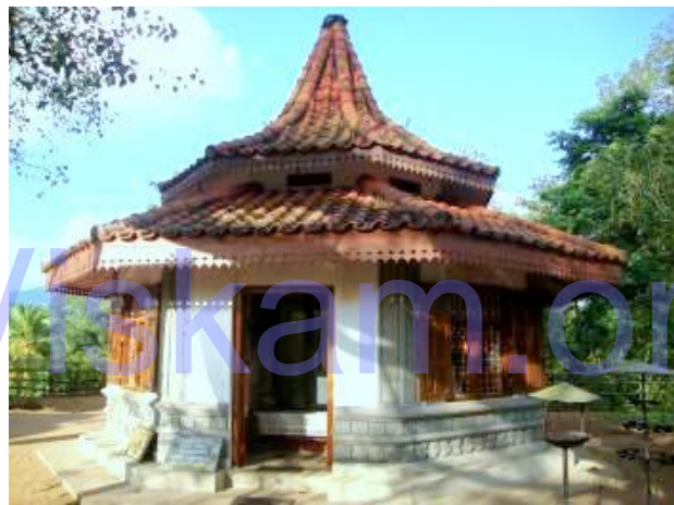
විහාරස්ථානයේ වර්තමාන අංග

දළදා වහන්සේ දෙල්ගමුව විහාරයේ වැඩ සිටිනා ආරංචිය ක්‍රමයෙන් ප්‍රචලිත වූයෙන් නැවත උන්වහන්සේට තර්ජනාත්මක තත්වයක් මතු විය. පෘතුගීසීන් පමණක් නොව අනෙකුත් ප්‍රාදේශීය රාජ්‍යයන්ගේ ප්‍රභූන් විසින් දළදාවහන්සේ පැහැර ගැනීමට උත්සාහකරන්නට වූහ. මෙවන් සැක සහිත අවස්ථාවලදී මහින්දාලංකාර හිමියන් දළදා වහන්සේ ඉනෙහි සහවාගෙන අවට ගම්මානවල හා පලාබත්ගල යන ස්ථාන වල සැඟවෙමින් දළදා වහන්සේ ආරක්ෂා කර ගත්හ. පසුව උපක්‍රමයක් මගින් දළදා වහන්සේ සහවා තැබීමට තීරණය කල උන්වහන්සේ කුරු ගඟෙන් ලැබුණු නිල මැණිකකින් ආවරණයක් කරවා දළදාව එයතුල බහාලූහ. ඉන්පසු විහාර මැදුරේ පහත මාලයේ අටරියන් බුද්ධ ප්‍රතිමාවට පිටුපසින් විශාල ප්‍රමාණයේ කුරහන් ගලක් තුල සහවා තැබූහ. මෙකල බොහෝදෙනා කුරහන් ගල් භාවිතා කල අතර මෙවන් විශාල කුරහන් ගල් විහාර කර්මාන්තයේදී ගල්, මැටි ආදිය සියුම්ව ඇඹරීම ආදී කටයුතු වලටද භාවිත කෙරුණි. මේ නිසාම මෙම කුරහන් ගල කිසිවෙක් සැක නොකළේය. දළදා මැදුරේදී පිළිම වහන්සේ ඉදිරිපිට පුද පූජා පවත්වන විට එය පෙරසේම දළදා වහන්සේට කරන පූජාවක්ම විය. මෙම රහස දැන සිටියේ මහින්දාලංකාර හිමියන් හා හිරිපිටියේ දිවෙනරාල පමණක් බව කියවේ. මෙලෙස ක්‍රි.ව. 1549 සිට 1592 දක්වා වසර 43 ක් දළදා වහන්සේ ආරක්ෂා වූයේ මෙම කුරහන් ගල් කරඬුව තුලය. කොනප්පු බණ්ඩාර නොහොත් පළමුවන විමලධර්මසූරිය රජතුමා ක්‍රි.ව. 1592 දී දෙවනගල රතනාලංකාර හිමියන්ගේ අනුග්‍රාහයෙන් පරිදි දළදාවහන්සේ මහනුවරට වඩම්වවා ගත්තේය. මහනුවර දළදා මාළිගයක් ඉදි කරන තෙක් තාවකාලිකව මහනුවර අස්ගිරියේ ගෙඩිගේ විහාරයේ හෙවත් ආදාහනමළු විහාරයේ තැම්පත් කරන ලදී. විමලධර්මසූරිය රජතුමා යටතේද