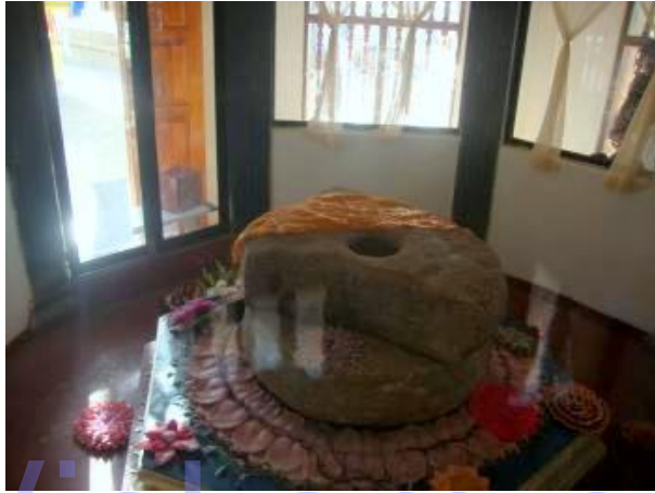
කුරුවිට දෙල්ගමුව රජමහා විහාරය සහ එහි කුරහන් ගල් කරඬුව

කෝට්ටේ යුගයේදී ප්‍රධාන භූමිකාවක් සිදු කල මෙම විහාරස්ථානයේ ඉතිහාසය ඉන් ඔබ්බටද දිවයයි. එහෙත් ඒ පිළිබඳ ලිඛිත සාක්ෂි ඇත්තේ ඉතා අල්ප වශයෙනි. මෙහි ඉතිහාසය ගැන කරුණු ගවේෂණය කරන්නෙකුට තොරතුරු ලබා ගැනීමට ඇති ප්‍රධානම මාර්ගයක් වන ජනප්‍රවාද, වර්තමානයේදී ක්‍රමයෙන් අභාවයට යමින් පවතී. මීට අමතරව රත්නපුර සමන් දේවාලයේ පුරාණ තුඩපත් හා ලේකම් මිටි, අතීතයේ ලියවුණු කාව්‍ය සහ ඓතිහාසික ග්‍රන්ථ කිහිපයක් අදටත් ඉතිරිව ඇත. දෙල්ගමුව විහාරය හා බැඳුණු නවත් තොරතුරු ප්‍රදේශයේ පැරණි පවුල් හා විහාරස්ථාන ආදියේ අප්‍රකටව ඇති ලේඛන වල සඳහන් බවට ප්‍රදේශයේ තතු දන්නෝ පවසති.