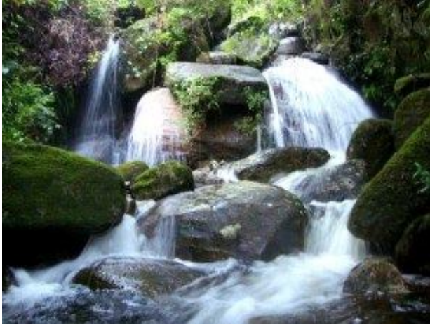
අතරමග වූ කුඩා දිය ඇල්ලක්