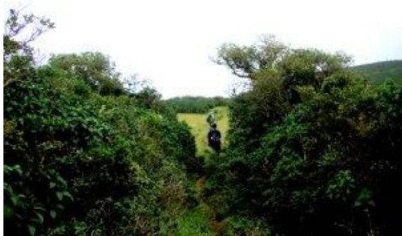
තණකොළ සහිත කඳු මුදුනේ මුල් දසුන

ඉදිරියට ගමන් කිරීමේදී සෙල්වම් සඳහන් කල ආකාරයේ වම්පසට විහිදෙන මාර්ගයක් හමු වූයෙන් ඒ ඔස්සේ ගමන් නොකර කෙලින් ගමන් කළෙමු. ටික දුරක් ගිය පසු මාර්ගය අපැහැදිලි වන බවක් දක්නට ලැබුණු අතර වනාන්තරයද සඹ විය. ජී.පී.එස්. උපකරණයද මෙම මාර්ගය නිවැරදි නොවන බව දැක්වූයෙන් අවට පිරික්සා බැලීමේදී පෙරකී වමට විහිදෙන මාර්ගයේ අතරමැද ස්ථානයක් හමු විය. ඒ ඔස්සේ ඉදිරියට යාමේදී එය නිවැරදි මාර්ගය බව පෙනී ගියේය (වමට විහිදෙන තවත් මාර්ගයක් පසුව හමු වූ අතර එය එතරම් පැහැදිලි එකක් නොවීය. කම්කරුවා සඳහන් කරන්නට ඇත්තේ එම මාර්ගය වියයුතුයැයි පසුව පැහැදිලි විය). මෙම ප්‍රදේශයේදී කන්දේ නැගීම තරමක් දැකිය හැකි වූ අතර මහරත් මල් ගස්, නෙළු මල් ගස්, මීවන ආදී ශාඛ මහ දෙපස දක්නට ලැබුණි. පෙ.ව. 10.20 පමණ වන විට අප ගමන් කරමින් සිටියේ සමතලා මාර්ගයක් ඔස්සේය. අප කඳු මුදුනට ඉතා ආසන්න බව හැඟී යන ගියේ තණකොළ පදුරු අතරින් මාර්ගය විහිදී තිබූ නිසාය. එසේම නෙළු හා අනෙකුත් ගස්වල වර්ණවත් භාවය හා මල් පිපී ඇති ප්‍රමාණය ක්‍රමයෙන් වර්ධනය වන අයුරු දක්නට ලැබුණි. පෙරවරු 10.25ට අප පිවිසියේ දැස් අදහාගත නොහැකි ලෙස නෙළු පදුරු වලින් වටවූ තණකොළ පදුරු වලින් වැසුණු විශාල දර්ශනීය හිස් භූමියකටයි. එම ස්ථානය දුටුවිටම අප තුල යම් අමුත්තක් පනිත කරවූයේ එම අලංකාර හා අසාමාන්‍ය පිහිටීම විය හැක. වචනයේ පරිසමාප්තාර්ථයෙන්ම එය හා අවට පරිසරය පාරාදීසයකි. එදින ඉතා පැහැදිලි පරිසරයක් සහිත දිනයක් වූයෙන් අවට මනාව දර්ශනය විය.