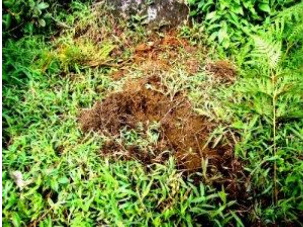
වල් උෟරෙකු විසින් බිම පළඳු කර