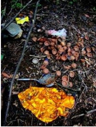
බිම විසිරුණු පුජා භාණ්ඩ