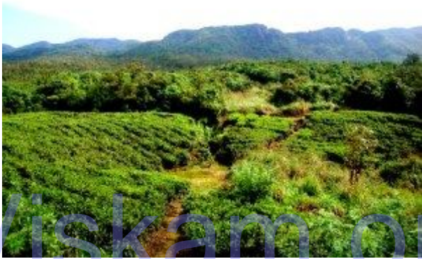
කැලෑවට ඇතුළුවන ස්ථානය