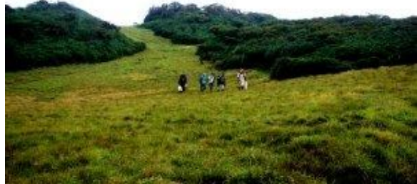
හිස් තණකොළ පිටිය

උතුර, නැගෙනහිර, දකුණ හා නිරිත දිග දෙසට වශයෙන් විහිදී යන මෙම හිස් පෙදෙස කඳු මුදුන පුරා විශාල ප්‍රදේශයක් පුරා පැතිරෙන අතර මදක් සමතලා ස්වභාවයක් ගනී. අතරින් පතර මහරත් මල් ගස් කිහිපයක්, සනච නෙළු පදුරු හා අමුතූම හැඩයේ පත්‍ර සහිත විවිධ ශාඛද දක්නට ඇත. සඹ නෙළු පදුරුවලට මායිම්වන සේ සනකම තණකොළ තට්ටු වැවී ඇත. එම තණකොළ අතර ඉතා අලංකාර කුඩා මල් පිපෙන පැළෑටි ඇති අතර වැල් ගොටුකොළ ශාකයද දක්නට ඇත. තණකොළ තට්ටුවට යටින් ඇතැම් තැනෙක ජලය ඇති අතර මදවශයෙන් එරෙන ස්වභාවයක්ද ඇත. ගිනිකොන දෙසට වන්නට පිදුරුතලාගල කඳු පංතියේ මීලග කන්ද දැකිය හැකි අතර එහි සිට ගලා එන පිරිසිදු දිය පහරක් ඇත.