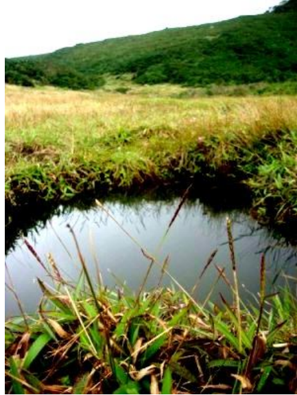
සීතාගේ කඳුළු පොකුණ

රාවනා රජතුමාගේ දඬුමොනර යන්ත්‍රය අහසින් ගමන් කල මාර්ගය මෙම ස්ථානය හරහා විහිදී තිබුන බවටත් සීතා දේවියව රාවනාගේ අග නගරය වූ ලංකාපුරයේ සිට අශෝක උයන වෙත රැගෙන යන අතරේ දඬු මොනරය මෙම ස්ථානයේ නතර කර සීතාට සිය රාජ්‍යයේ අලංකාරය පෙන්වූ බව කියවේ. කඳු මුදුනේ හිස් තණකොළ ඇති කොටසේ කිසිදු විශාල ගසක් නොවැවෙන අතර අදටත් එය එසේම දක්නට ලැබේ. සීතා දේවිය ඇඬූ කඳුලීන් මෙම ස්ථානයේ කුඩා පොකුණක් නිර්මාණය වූ බවත් එම පොකුණ “සීතාගේ කඳුළු පොකුණ” නම් වූ බවත් පැවසේ. මෙම කුඩා පොකුණ අදත් මෙම ස්ථානයේ ගිනිකොණ දෙසට වන්නට දක්නට ඇත. දැඩි නියගයකදී අවට ගංගා, දිය පහරවල් සිදී ගියද මෙම පොකුණ සිදී නොයන බවට පැවසේ. ඉන්දියානුවන් තුල මෙම ප්‍රදේශය අවට ඇති මහරත් ගස් වල මල් පිළිබඳවද මෙවන් අදහසක් පවතී. ඒ මහරත් මලේ පෙනුම රාමගේ රුව සිහිගන්වන බවත් රතු පැහැති මේ මල “සීතා මල” නමින් හඳුන්වන බවත්ය. “සීතා මල” නොහොත් මහරත් මල ඉහල කඳුකරයේ පමණක් දක්නට ලැබේ.