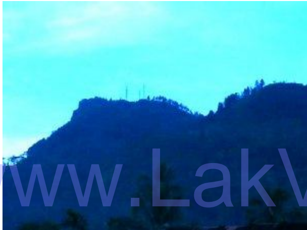
මොනරගල (පිකොක් හිල්ස්)

මෙම ගමනට අවශ්‍ය කැම බීම, ඇඳුම් පැළඳුම්, කුඩාරම් ආදී සියල්ල කොළඹ සිට ගෙනයාමට අප තීරණය කළෙමු. ඒ ගමනේ අතරමඟට වැය වන කාලය අවම කර ගැනීමටයි. රාත්‍රී 10 නුවරඑළිය ලංගම බසයේ ආසන කලින් වෙන්කරවා ගැනීමට අප සමත් වූයෙමු. මිතුරකුගේ නිවසේ නතරවීමට තීරණය කල අප පාන්දර 2.30 ට පමණ පුස්සැල්ලාවෙන් බැස මිතුරාගේ නිවසට ගොස් නින්දට වැටුනෙමු. උදෑසන අවදිවූ මාහට නිරිතදිග දෙසින් දැක ගන්නට ලැබුනේ මනස්කාන්ත මොනරගල කන්දයි (පිකොක් හිල්ස්) (1518 m). එදින මීදුම තදින් නොතිබූ පැහැදිලි දිනයක් වූ නිසා මෙම කඳුවැටිය හොදින් දර්ශණය විය.