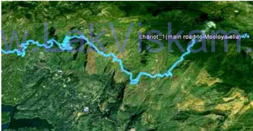
අපගේ පළමු දින ගමන් මඟ

පසුදින උදෑසන ක්ෂණික නුඩල්ස් සකසා ආහාරයට ගෙන හේවාහැට දෙසින් මුල් ඔය වන්න බලා ගමන් ආරම්භ කළෙමු. ෆොට්‍රොක්ට් වන්නේ සිට වූ නැගීමට වඩා ඉතා දළ බැවුමක් මුල් ඔය වන්න දෙසට විය. මෙදින ගමනේදී අපට විවිධ ප්‍රමාණ වල දිය ඇලි 4 ක් පමණ හමු විය. මේ දිය ඇලි බොහොමයක් වනාන්තරය ඇතුළට වන්නට පිහිටා ඇති නිසා පැහැදිලි ඡායාරූපයට නැගීම අපහසු විය. පැය දෙකක පමණ ගමනකින් පසු තේවන්නේ ආරම්භක මායිමට පැමිණීමට හැකි විය. ඉතා දර්ශනීය මුල් ඔය වන්න හරහා මාර්ගයට පැමිණ මුල්ඔය වන්න - මහනුවර බසයට ගොඩ වූයෙමු. මෙම බසයෙන් රිකිල්ලගස්කඩ හරහා මහනුවරට පැමිණ කොළඹ බලා ආවෙමු.