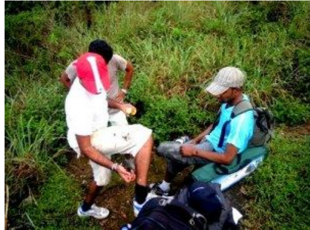
කුඩැලි විකර්ෂක අලේප කරමින්

ඉදිරියට ගමන් කිරීමේදී සෙල්වම් සඳහන් කල ආකාරයේ වම්පසට විහිදෙන මාර්ගයක් හමු වූයෙන් ඒ ඔස්සේ ගමන් නොකර කෙලින් ගමන් කළෙමු. ටික දුරක් ගිය පසු මාර්ගය අපැහැදිලි වන බවක් දක්නට ලැබුණු අතර වනාන්තරයද සඹ විය. ජී.පී.එස්. උපකරණයද මෙම මාර්ගය නිවැරදි නොවන බව දැක්වූයෙන් අවට පිරික්සා බැලීමේදී පෙරකී වමට විහිදෙන මාර්ගයේ අතරමැද ස්ථානයක් හමු විය. ඒ ඔස්සේ ඉදිරියට යාමේදී එය නිවැරදි මාර්ගය බව පෙනී ගියේය (වමට විහිදෙන තවත් මාර්ගයක් පසුව හමු වූ අතර එය එතරම් පැහැදිලි එකක් නොවීය. කම්කරුවා සඳහන් කරන්නට ඇත්තේ එම මාර්ගය වියයුතුයැයි පසුව පැහැදිලි විය). මෙම ප්‍රදේශයේදී කන්දේ නැගීම තරමක් දැකිය හැකි වූ අතර මහරත් මල් ගස්, නෙළු මල් ගස්, මීවන ආදී ශාඛ මහ දෙපස දක්නට ලැබුණි. පෙ.ව. 10.20 පමණ වන විට අප ගමන් කරමින් සිටියේ සමතලා මාර්ගයක් ඔස්සේය. අප කඳු මුදුනට ඉතා ආසන්න බව හැඟී යන ගියේ තණකොළ පදුරු අතරින් මාර්ගය විහිදී තිබූ නිසාය. එසේම නෙළු හා අනෙකුත් ගස්වල වර්ණවත් භාවය හා මල් පිපී ඇති ප්‍රමාණය ක්‍රමයෙන් වර්ධනය වන අයුරු දක්නට ලැබුණි. පෙරවරු 10.25ට අප පිවිසියේ දැස් අදහාගත නොහැකි ලෙස නෙළු පදුරු වලින් වටවූ තණකොළ පදුරු වලින් වැසුණු විශාල දර්ශනීය හිස් භූමියකටයි. එම ස්ථානය දුටුවිටම අප තුල යම් අමුත්තක් පනිත කරවූයේ එම අලංකාර හා අසාමාන්‍ය පිහිටීම විය හැක. වචනයේ පරිසමාප්තාර්ථයෙන්ම එය හා අවට පරිසරය පාරාදීසයකි. එදින ඉතා පැහැදිලි පරිසරයක් සහිත දිනයක් වූයෙන් අවට මනාව දර්ශනය විය.