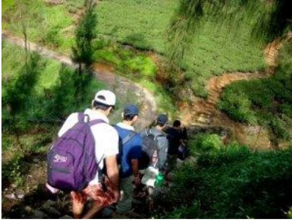
කන්ද වෙත යන පා ගමන ආරම්භ කරමින්