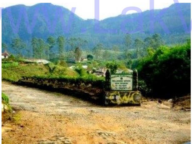
පෙට්ටරාසි බස් මාර්ගය හමුවන තුන්මං හන්දිය

අප ගමන්ගත් මාර්ගය පෙට්ටරාසි බසය ගමන් කරන මාර්ගයට අතරමඟදී සම්බන්ධ වේ. එම ස්ථානයේ සිට අගලවත්ත වැව්ලී සමාගමට අයත් ෆොටෝට් වත්ත ඔස්සේ ගමන් කල යුතුය. අබලන් තත්වයේ පවතින මෙම මාර්ගයේදී නව ෆොටෝට් ප්‍රාදේශීය රෝහල හා කෝවිල් කිහිපයක් හමු වේ. පෙ.ව. 8.20 වන විට අප බස් මාර්ගයේ අවසානය වන අත්හැර දැමූ පැරණි ෆොටෝට් රෝහල අසලට ළඟා වූයෙමු. වැන්රියේ ගාස්තුව ගෙවා ෆොටෝට් රෝහල අසල සිටි කම්කරුවන්ගෙන් ගමන් මාර්ගය පිලිබඳව අවබෝධයක් ලබා ගත්තෙමු. දෙමළ භාෂාව දන්නා මිතුරන් දෙදෙනෙකු කණ්ඩායමේ සිටීම ගමන පුරාවට අපට අත්වැලක් විය. ගමනේ ආරම්භක ස්ථානයට තේ වතු මැදින් ඉහලට ගමන් කල යුතුය. මෙහිදී පැහැදිලි දිය පාරක් හමු වන අතර බීමට අවශ්‍ය ජලය මෙහිදී පුරවාගත හැක. මිනිස් වාසස්ථාන ප්‍රදේශයේ ඇත්තේ අල්ප වශයෙනි. දුරකථන සංඥා දුර්වල මට්ටමක පැවතියත් බොහෝ ස්ථාන වලට ඇමතුමක් ලබා ගැනීමට හැකි ප්‍රමාණයට සංඥා ලැබේ.