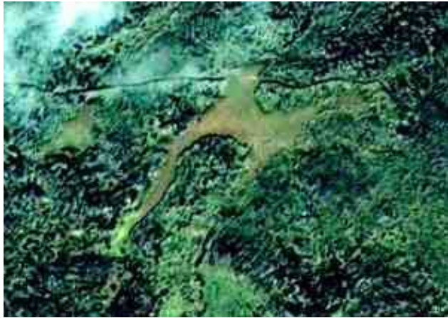
කඳු මුදුන වන්දිකා ජයාරූපයෙන් දිස්වෙන අයුරු