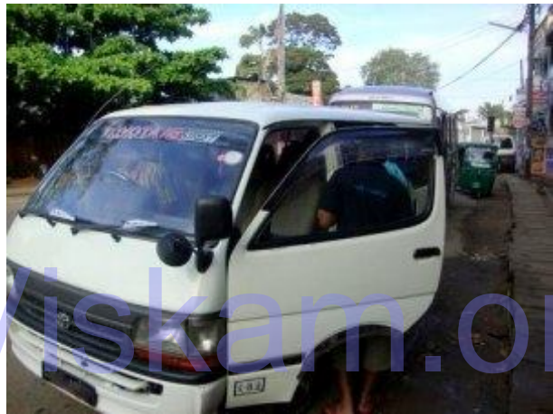
පුස්සැල්ලාවේ සිට පිටත්වීමට සූදානම්වී

උදේ ආහාරයට මිතුරාගේ නිවසින් ලබාදුන් කිරිබත් අනුභවකර පෙරවරු 6.55 ට පුස්සැල්ලාවෙන් ගමන් ආරම්භ කළෙමු. තවත් මිතුරන් තිදෙනෙකු පුස්සැල්ලාවේදී එක්විය. “ෆොට්‍රොෆ්ට්” නොහොත් “පෙට්ටරාසි” වත්ත පිහිටා ඇත්තේ ජේරාදෙණිය - නුවරඑළිය මාර්ගයේ නුවරඑළිය දෙසට යනවිට, වම් පසින් රම්බොඩ කඳු වල ඇතුල් පැත්තට වන්නට, පුස්සැල්ලාව හා රම්බොඩ දිය ඇල්ල අතර වේ. ෆොට්‍රොෆ්ට් දක්වා බේල්ටා වත්ත හරහා දිවෙන බස් මාර්ගය කඳුකර හා දුෂ්කර වූ ඉතා අබලන් වූ මාර්ගයකි. පුස්සැල්ලාවේ සිට ෆොට්‍රොෆ්ට් වත්ත දක්වා ගමන් කරන “පෙට්ටරාසි” බස් රථ කිහිපයක් ඇත. මෙම බස් බොහෝ විට අධික ලෙස මගීන්ගෙන් පිරී ඇත. අප කණ්ඩායමේ නව දෙනෙකු සිටි නිසාත් කුඩාරම් ඇතුළු ගමන් මළ වූ නිසාත් මිතුරෙකු මාර්ගයෙන් රු. 3000/= ක කුලියට වෑන් රථයක් කලින් සුදානම් කරගත්තෙමු. දවල් ආහාරය සඳහා තොසේ මීලට ගෙන වෑන් රථයෙන් පෙ.ව.7.15 ට පුස්සැල්ලාව නගරයෙන් ගමන ආරම්භ කළෙමු. පෙට්ටරාසි - පුස්සැල්ලාව බස් රථය ගමන් කරන මාර්ගය ඉතා අබලන් නිසා ජේරාදෙණිය නුවරඑළිය මාර්ගයේ රම්බොඩ දෙසට ගමන් කර පුස්සැල්ලාව වැටීලි සමාගමට අයත් “හෙල්බොඩ වත්ත” මැදින් දිවෙන වතු මාර්ගයක් ඔස්සේ ගමන් කළෙමු. මෙම මාර්ගය ඇතැම් ස්ථාන වලදී ඉතාමත් පටු වන අතර ඇතැම් ස්ථාන කොන්ක්‍රීට් අතුරා සකසා ඇත. අතිශය නොත්කළ දර්ශන පෙළක් මෙම මාර්ගයේදී නැරඹීමට හැකි විය. මේ අතර කොන්මලේ ජලාශය, ශ්‍රී පාද කන්ද, මොනර ගල (පිකොක් හිල්ස්), කිකිලියාමාන කඳු, කබරගල කඳු, පිදුරුතලාගල කඳු සහ අවට තේ වතු ප්‍රධාන වේ. හෙල්බොඩ වතුයායේ ඉහල කොටසේදී තරමක් කැලෑබද ප්‍රදේශයන් හමු වන අතර “දිවියන්ගෙන් ප්‍රවේශම් වන්න” යනුවෙන් සඳහන් දැන්වීම් පුවරුද සවිකොට ඇත.