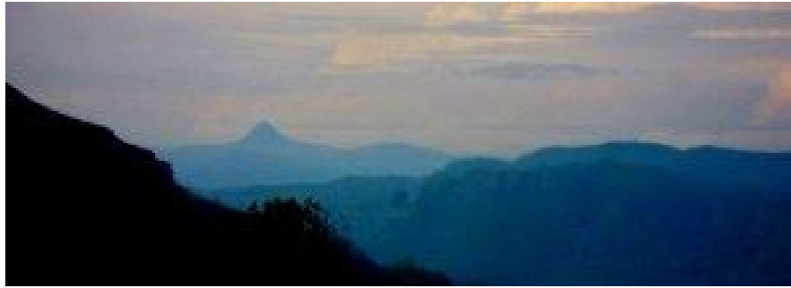
සිරිපා කඳු මුදුන

අවට භූමිය පරික්ෂා කිරීමේදී මාස කිහිපයකට පෙර යම්කිසි පුද්ගලයින් පිරිසක් නිදන් හැරීමට ගත් උත්සාහයක් වැනි දෙයක සලකුණු දක්නට ඇත. ඒ සඳහා භාවිතා කල පුජා භාණ්ඩ ආදිය බිම විසිරී තිබෙන අයුරුත් විශාල වලක් හාරා තිබෙන අයුරුත් නිරීක්ෂණය කල හැකි විය. ක්‍රමයෙන් දහවල ලගා වූයෙන් බිස්කට් අනුභව කර ජලය නැවත පුරවාගෙන ගිනිකොන දෙසින් වූ පිදුරුතලාගල කඳු පංතිය ඔස්සේ ඉදිරියට යාම ආරම්භ කළෙමු. කිසිදු පැහැදිලි අඩි පාරක් හෝ නොතිබුණු මෙහි සන නෙළු පදුරු අතරින් ඉදිරියට යාම ඉතාමත් අභියෝගජනක, අනන්‍යදායක හා කාලය විශාල වශයෙන් වැයවන බව පෙනුණු නිසා එම අදහස මතුවට ඉතිරිකොට නැවත පෙර කී තණකොළ පිටියට පැමිණ කඳවුරු බැදීමට තීරණය කළෙමු. මේ අවස්ථාවේ ගෝනුන් කැගසන ශබ්දය පැහැදිලිව ඇසුණු අතර ඔවුන් අපගේ පැමිණීම නොරිස්සුවාසේය. අඩි පාරේ ලිස්සනසුලු ස්වභාවය නිසා අප සගයන් දෙදෙනකු පය ලිස්සා වැටුණු අතර ඉන් එක් අයකුගේ අත ගලක වැදී අස්ථි පිපිරීමක් සිදු විය. ඔහුට ප්‍රථමාධාර ලබා දෙන අතරතුර එතෙක් පැහැදිලිව තිබුණු පරිසරය ක්‍රමයෙන් අදුරුවී මිදුම ගලා එන්නට විය. වැසි වලාකුළු හා ගිගුරුම් හඩ වර්ෂාව ඉතා ආසන්න බවට සන්නිවේදනය කළේය. අප තෝරාගත් ස්ථානයේ කුඩාරම් ඇටවීම සිදුකරන අතරේ පොදු වර්ෂාවක් ආරම්භ විය. එවිට වෙලාව ප.ව. 12.35 විය.