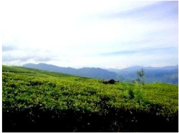
මෙහි දිස්වන්නේ “පාවල මලයි”(මුතු කන්ද) ද?

හනුමාන් භාරතයේ සිට සීතා සොයා ලංකාව දෙසට එක පිම්මේ පැන්න බවත් ලංකාවේදී හනුමා ඔහුගේ පළමු පාදය තැබුවේ මෙම කඳු මුදුනකට බවත් කියවේ. රාවනා රජුගේ අගනගරය වන "ලංකාපුර" නකල්ස් කඳු පංතියේ මීමුරේ ආසන්නයේ ඇති ලකේගල ආශ්‍රිතව හෝ මෙම පිදුරුතලාගල කඳු පංතිය ආශ්‍රිතව තිබූ බවට පැවසේ. එසේම රාමායනයට අනුව සීතා දේවිය රැඳවූ අශෝක උයන නොහොත් "අශෝක වටික" නම් ස්ථානය පිහිටියේ නුවරඑළිය හක්ගල කන්ද ආශ්‍රිතව ඇති වනාන්තරයේ බවට සැලකේ. ලොට්‍රොල්ට් වන්නේ සිට දිස්වන මෙම "මුතු කන්ද" දැකිය හැක්කේ මෙම ලංකාපුර හා අශෝක වටික ස්ථාන දෙක අතරින් බව කියවේ. මෙම ස්ථාන සිතියමක සලකුණු කල විට මෙම "මුතු කන්ද" දිස්විය යුත්තේ නැගෙනහිර හා ගිනිකොන අතරින් නැගෙනහිර දෙසට වඩාත් බරවය. මෙවිට මුලින්ම දෘශ්‍යමාන වන්නේ පිදුරුතලාගල කඳු පන්තියේම කඳුය. මෙය බොහෝවිට මෙම මුතු කන්ද යනුවෙන් හඳුන්වන ස්ථානය විය යුතුය. මෙම කඳුවලට පසුපසින් එළමුල්ල ප්‍රදේශයේ කබරගල්ල කඳු පසුතලයෙන් දිස් වේ.