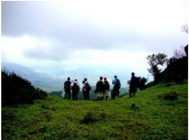
නිරිත දිග දළ බැවුම අසල

නිරිතදිග දෙසට විහිදී යන හිස් තණකොළ සහිත භූමිය මදක් ඉහලට එසවෙමින් ගොස් එක්වරම දළ බැවුමක් බවට පත්වී එම බැවුම දිගේ පහලටද තණකොළ පදුරු විහිදී යයි. දඬුමොනර යන්ත්‍රය ගුවන් ගතවීම වර්තමාන ගුවන් යානයක ආකාරයට සිදු වූයේ නම් එයට වඩාත්ම සුදුසු ධාවන පථය මෙය විය යුතුය. මෙම දළ බැවුම් ස්ථානයේ සිට බලන විට කොත්මලේ ජලාශය හා හැටන් දෙසින් ශ්‍රී පාද කඳු මුදුන හොදින් දර්ශණය වේ.