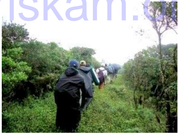
පසුදින ගමන් ආරම්භ කරමින්

හැකි ඉක්මනින් කුඩාරම් තුනම අටවාගත් අප වර්ෂාවේම තෙත බරිතව ඇතුලට රිංගා ගනිමු. අධික වෙහෙස හා වර්ෂාව නිසා කුසගින්න තදින් දැනුනෙන් දවල් ආහාරයට ගෙන ආ තොසේ කුඩාරම් අතර හුවමාරු කරගෙන අනුභව කළෙමු. තද සුළග, වර්ෂාව හා මිදුම නිසා සිතලෙන් පීඩා විදීමට අපට සිදු විය. කුඩාරම් ඇතුලට වතුර බිංදු වහනය වන්නට වූයෙන් අප වඩාත් අපහසුතාවයට පත් වූයෙමු. වර්ෂාව අඩු වූ විට පිටත බැලූ අපට පෙනුනේ තද මිදුමෙන් අවට වැසි ඇති පරිසරය හා කලින් සඳහන් කල ජල පහර ඉතා විශාල ජල පහරක්වී ශබ්ද නගමින් කන්දෙන් පහලට ගලා එන අයුරුයි. වර්ෂාව අඩු වැඩි වෙමින් සවස 6 පමණ වනතෙක් පැවතුනි. එදින පසළොස්වක පොහොය දිනයක් වූයෙන් රාත්‍රියේ පුන් සඳ පායා පැහැදිලි අහසක් දක්නට විය. රාත්‍රී ආහාරයට සැමන් සම්බෝලයක් සකස් කර මාපරින් සමග පාන් අනුභව කොට නින්දට ගියෙමු. අධික සිතල නිසා නින්ද අසලකවත් නොවීය. අවදිව සිටින අවස්ථා වලදී අප ගෙනගිය විශාල ඉටිපන්දම් කුඩාරම් ඇතුලේ දල්වා තරමක් හෝ උණුසුම් සපයා ගත්තෙමු.