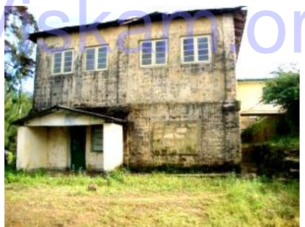
පැරණි ෆොටෝට් රෝහල

මෙහිදී රාවනා රජුගේ අගනගරය පිහිටි ස්ථානය ලෙස අනුමාන කරන “ලංකාපුර” පෙදෙස හා සීතා දේවිය රැඳවූ අශෝක උයන අතරින් දිස්වෙන කඳු පංතිය පිලිබඳව ඇති තොරතුර ගවේෂණය කිරීමටද අප අමතක කලේ නැත. එම තොරතුරු අනුව මෙම ෆොටෝට් වත්තේ සිට ඉහත කී ස්ථාන දෙක අතරින් දිස්වන කඳු පංතියේ ඇති කඳු මුදුනකක් “පාවල මලයි” නම් වේ. එහි අදහස නම් “මුතු කන්ද” යන්නයි.