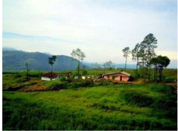
කොත්මලේ ජලාශය හා ෆොටෝට් වත්තේ සිට දුටු අවට අසිරිය

අප ගමන්ගත් මාර්ගය පෙට්ටරාසි බසය ගමන් කරන මාර්ගයට අතරමඟදී සම්බන්ධ වේ. එම ස්ථානයේ සිට අගලවත්ත වැව්ලී සමාගමට අයත් ෆොටෝට් වත්ත ඔස්සේ ගමන් කල යුතුය. අබලන් තත්වයේ පවතින මෙම මාර්ගයේදී නව ෆොටෝට් ප්‍රාදේශීය රෝහල හා කෝවිල් කිහිපයක් හමු වේ. පෙ.ව. 8.20 වන විට අප බස් මාර්ගයේ අවසානය වන අත්හැර දැමූ පැරණි ෆොටෝට් රෝහල අසලට ළඟා වූයෙමු. වැන්රියේ ගාස්තුව ගෙවා ෆොටෝට් රෝහල අසල සිටි කම්කරුවන්ගෙන් ගමන් මාර්ගය පිලිබඳව අවබෝධයක් ලබා ගත්තෙමු. දෙමළ භාෂාව දන්නා මිතුරන් දෙදෙනෙකු කණ්ඩායමේ සිටීම ගමන පුරාවට අපට අත්වැලක් විය. ගමනේ ආරම්භක ස්ථානයට තේ වතු මැදින් ඉහලට ගමන් කල යුතුය. මෙහිදී පැහැදිලි දිය පාරක් හමු වන අතර බීමට අවශ්‍ය ජලය මෙහිදී පුරවාගත හැක. මිනිස් වාසස්ථාන ප්‍රදේශයේ ඇත්තේ අල්ප වශයෙනි. දුරකථන සංඥා දුර්වල මට්ටමක පැවතියත් බොහෝ ස්ථාන වලට ඇමතුමක් ලබා ගැනීමට හැකි ප්‍රමාණයට සංඥා ලැබේ.